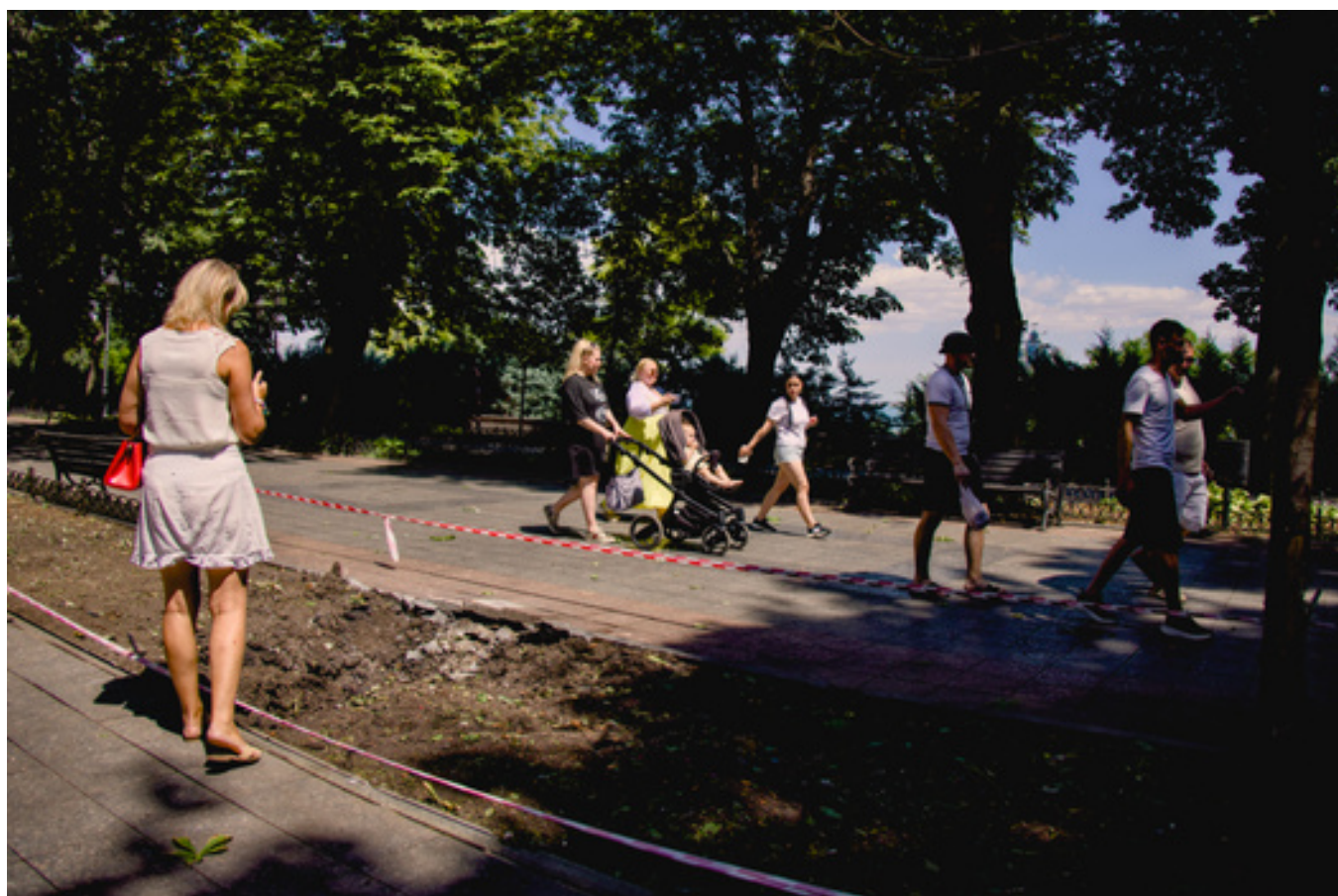
Воронка от попадания беспилотника на Приморском бульваре