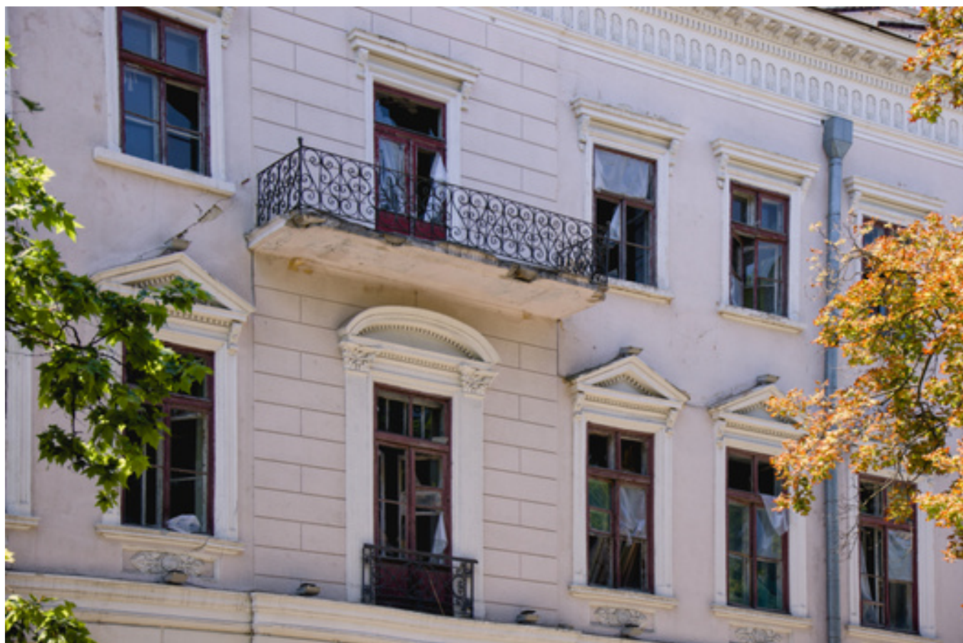
Выбитые стекла в Доме Золотарева, построенном в 1820-х годах Тимофей Мельников