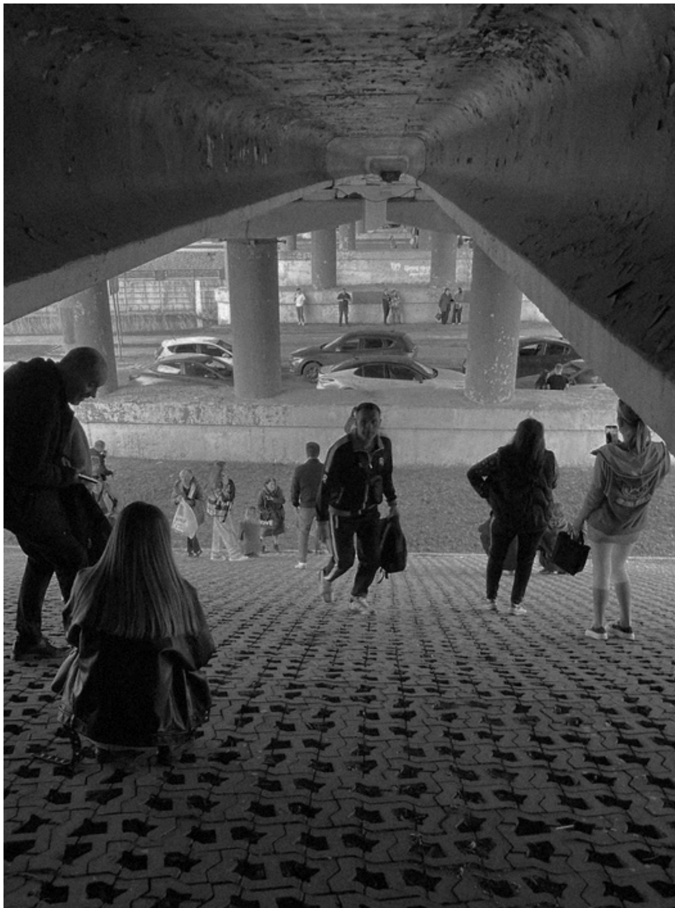
Белгородцы укрываются под мостом во время ракетной опасности