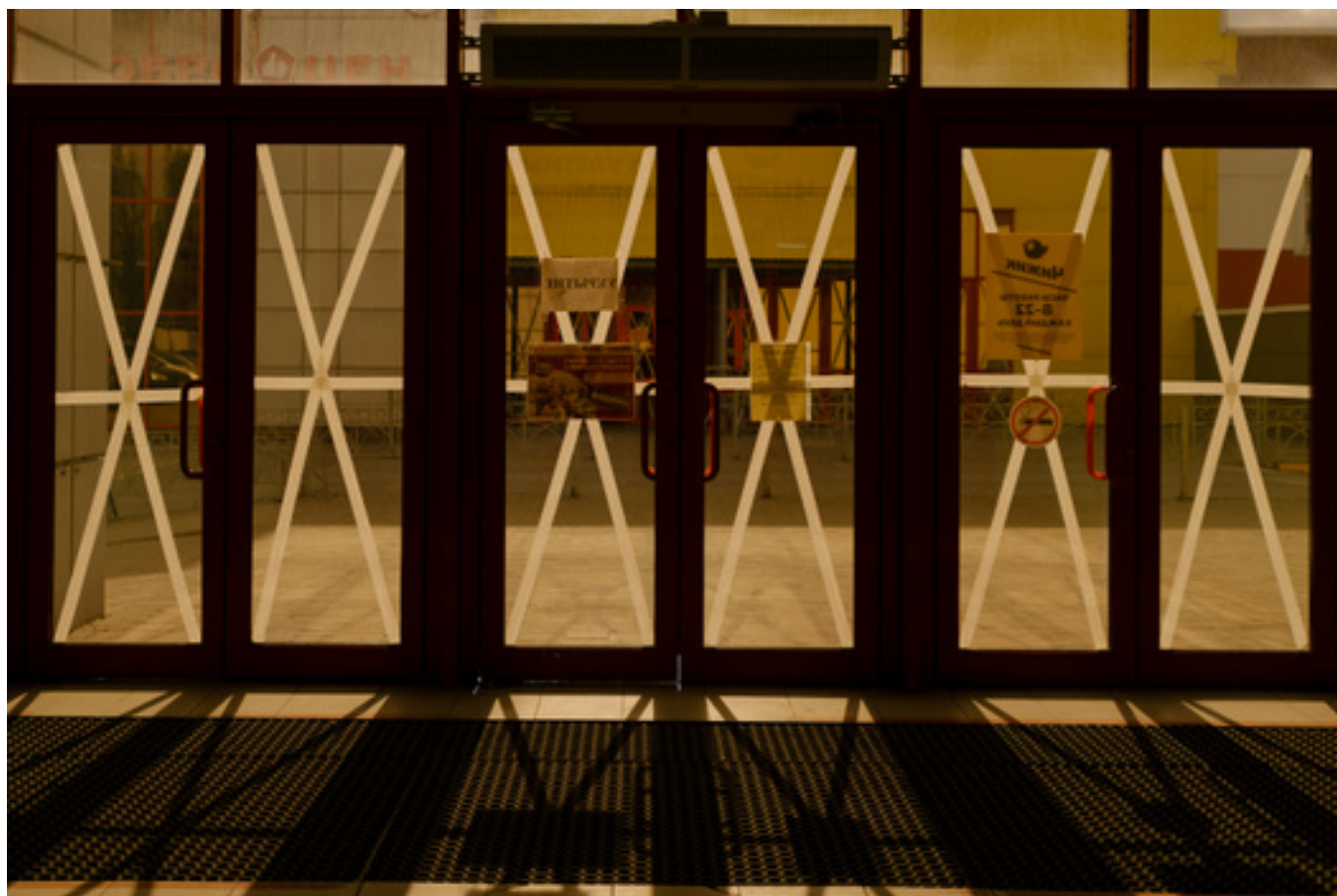
Вход в один из торговых центров «Берег»

Я открыл новости — и увидел, что случилась беда. Тогда, наверное, я в первый раз впал в жесткую депрессию: вроде праздник, а ты читаешь новости и там с каждым часом растет количество жертв. Мы даже не праздновали Новый год, просто сидели и все.