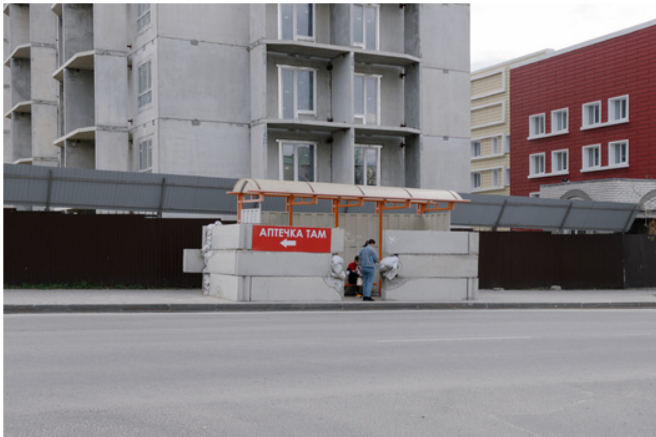
Остановка, укрепленная бетонными блоками «Берег»