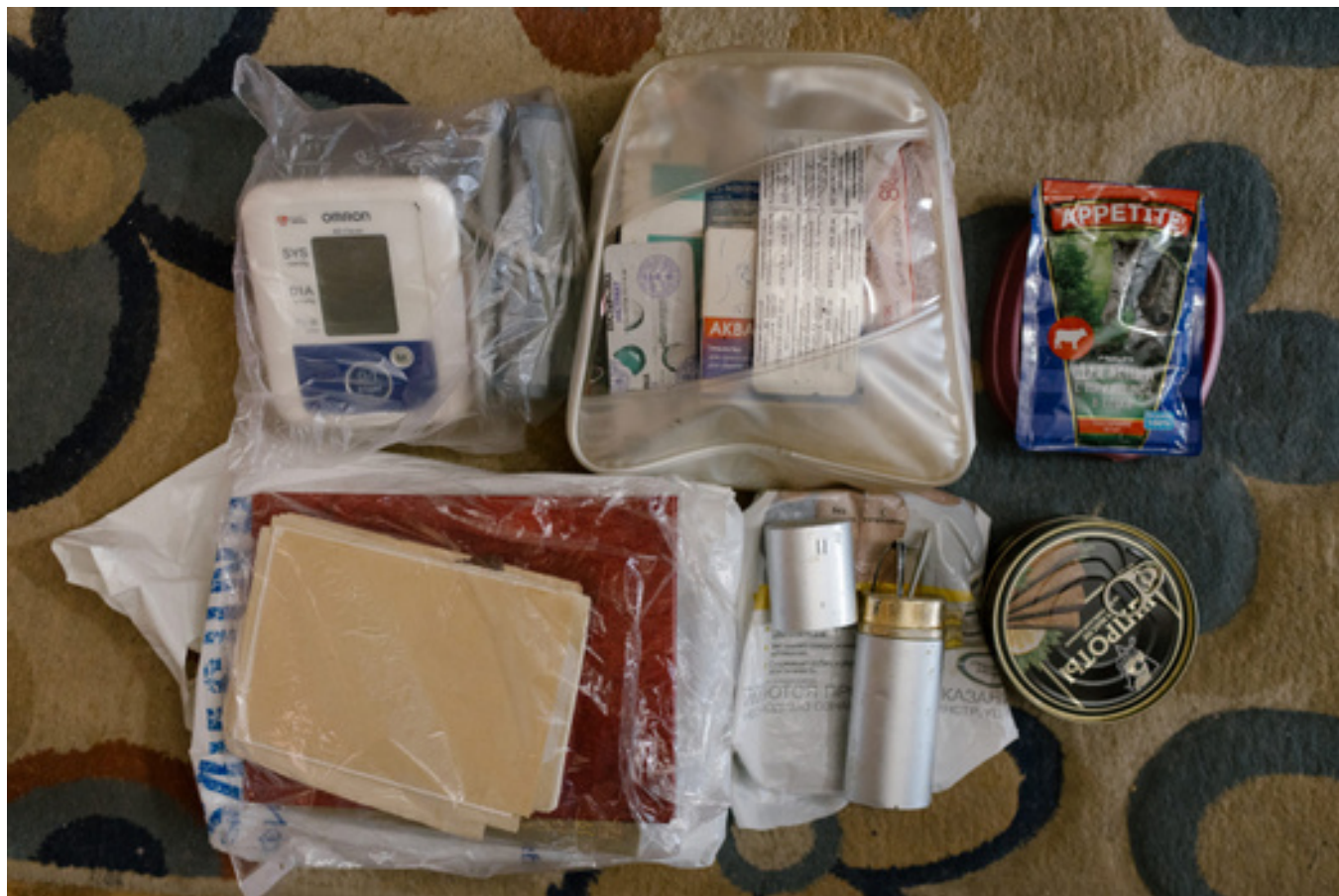
«Тревожный чемоданчик» одного из жителей Белгорода «Берег»

сидели на лавочке у закрытого подвала. Сейчас я понимаю, что это самое неразумное, что можно было сделать. Но мы поступили так из-за нехватки информации.