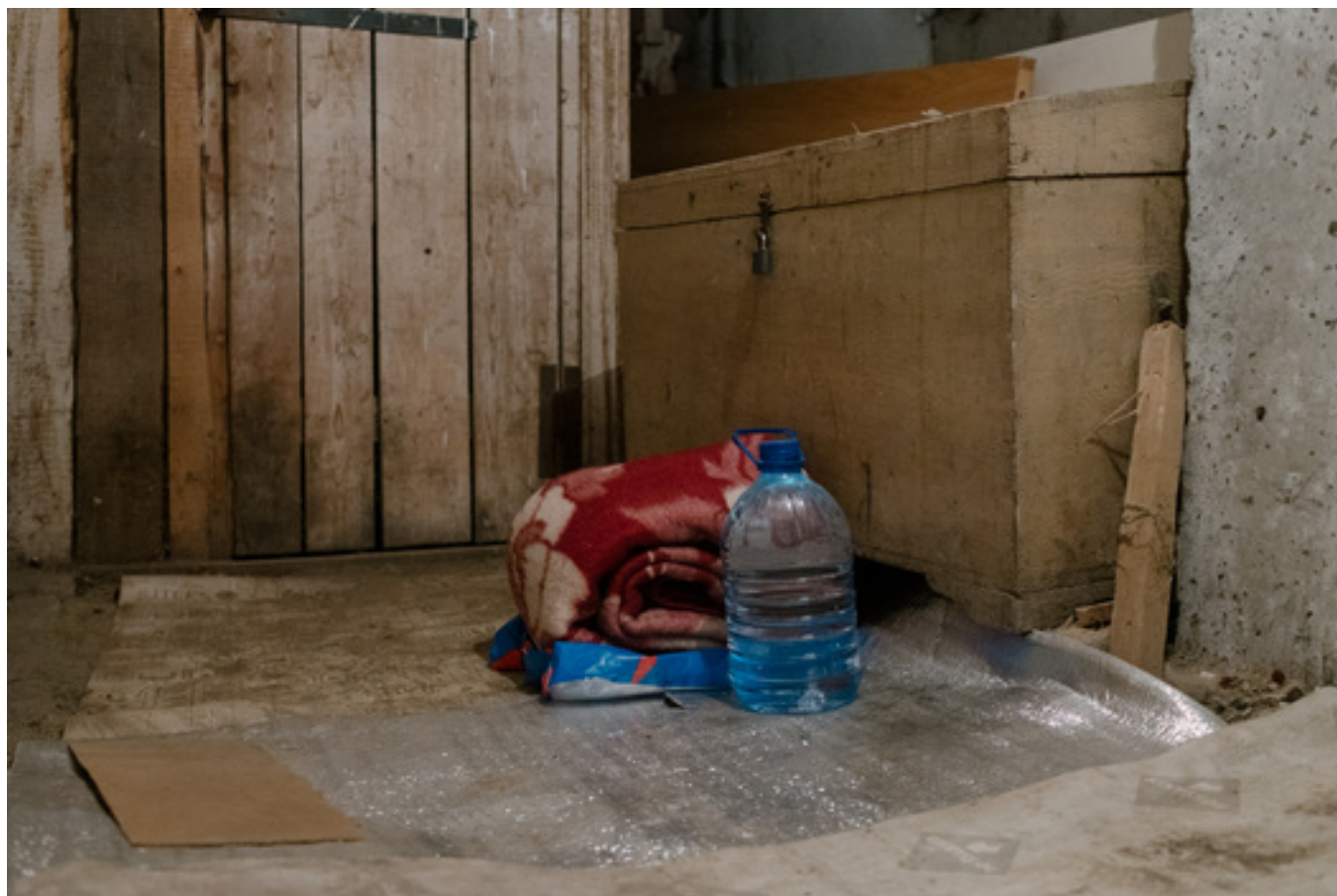
Одно из укрытий в подвале многоквартирного дома «Берег»

Раньше у меня был тревожный чемоданчик, а сейчас нет, что странно. Когда война началась, я собрала нужные вещи, документы. А сейчас у меня паспорт в сумке и банковская карта. Остальное все равно не вывезешь. Надеюсь, и не понадобится. Но, наверное, стоит его [тревожный чемоданчик] заново собрать.