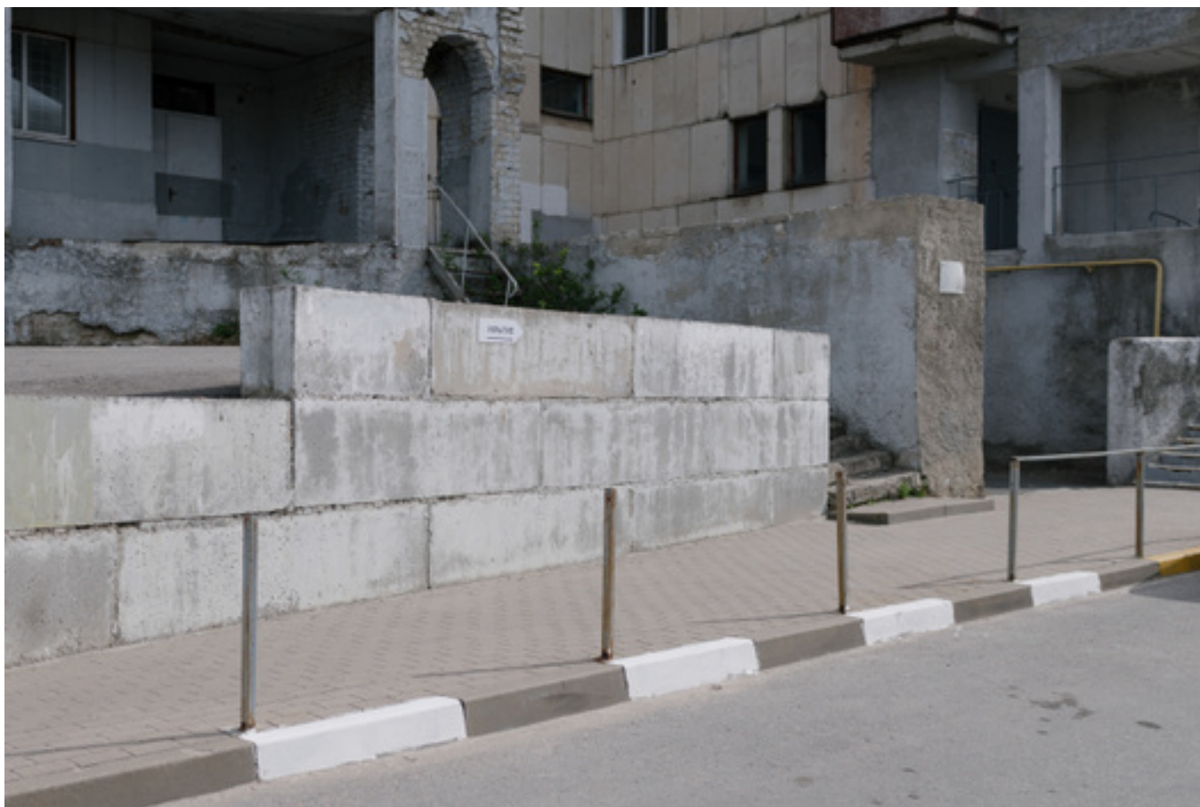
Указатель в укрытие в многоквартирном доме «Берег»

Мое поведение на улице изменилось. Всегда смотрю, где ближайшее укрытие и указатели к ним. Я начала бояться долго находиться на открытом пространстве. Практически не гуляю: выхожу только по необходимости.