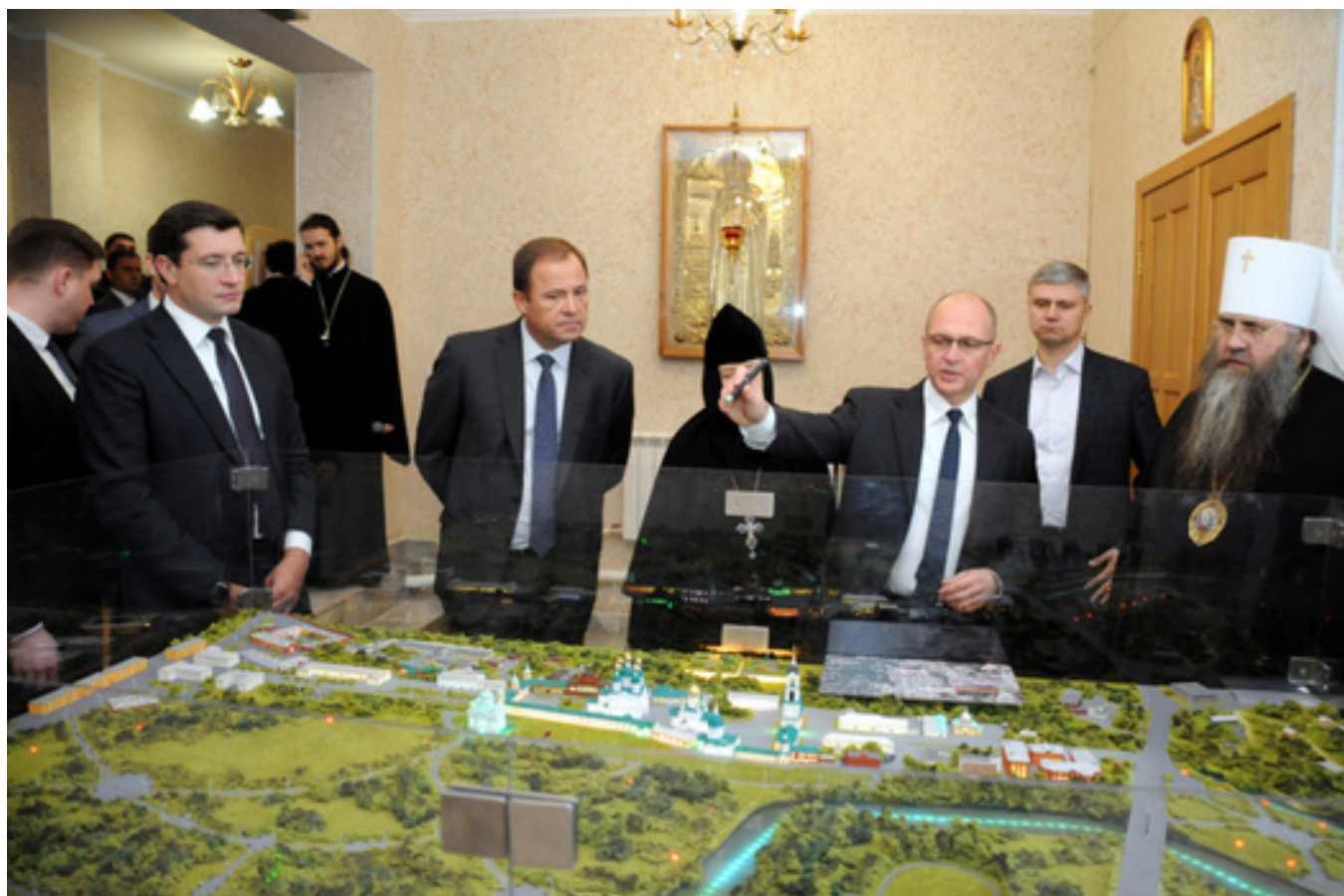
Сергей Кириенко на заседании попечительского совета по возрождению Дивеевской обители в селе Дивеево Нижегородской области. 17 ноября 2018 года