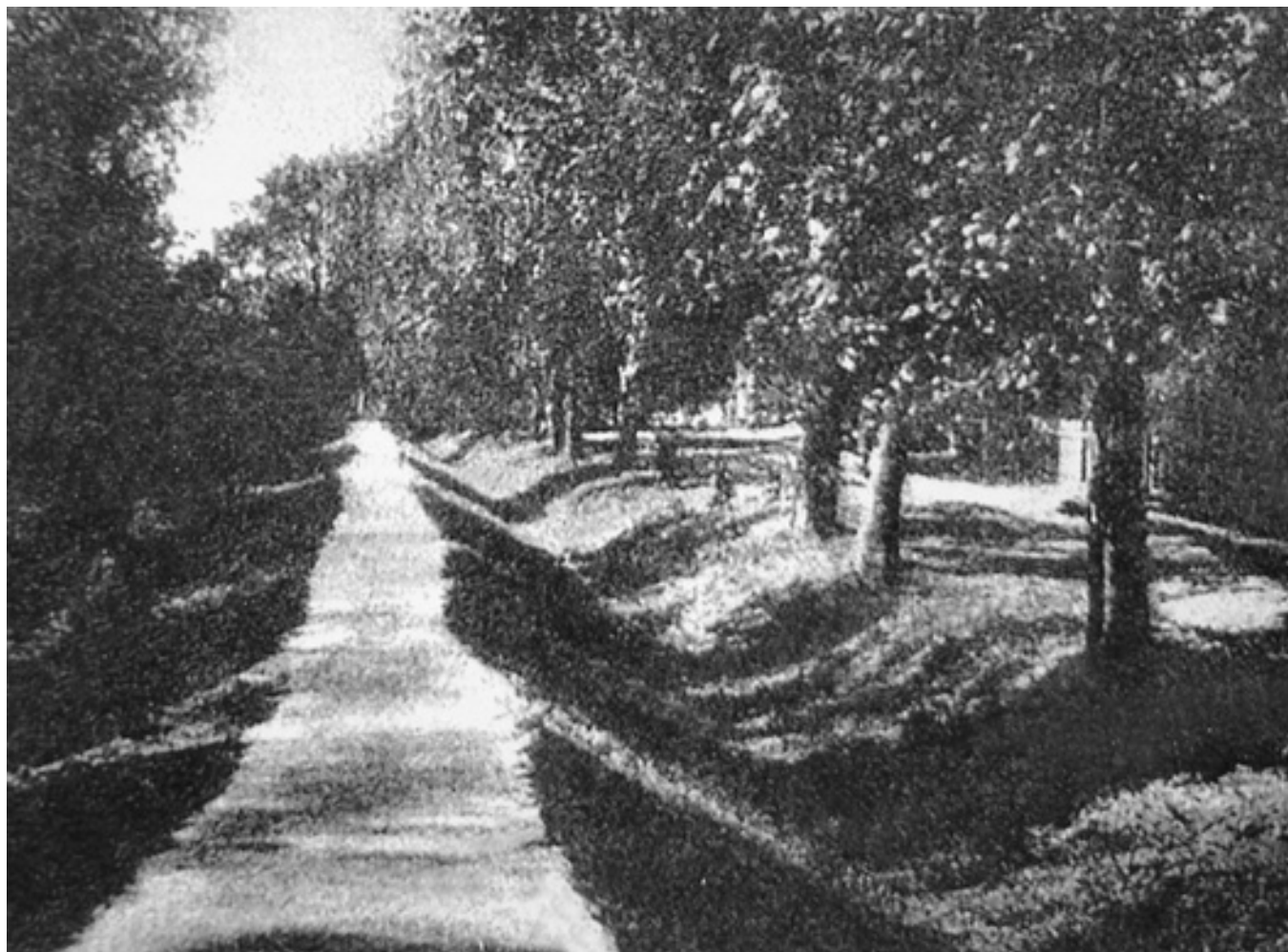
Святая Канавка в первые годы XX века.