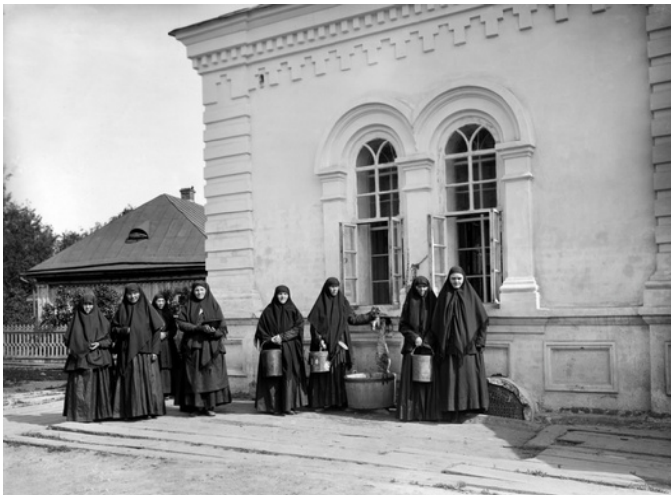
Монахини у колодца в Серафимовском монастыре в селе Дивеево. 1904 год

архитектуру посмотреть. Для технической интеллигенции Нижегородской области, а затем и для бюрократии [из Москвы] таким монастырем стало Дивеево», — рассказывает «Медузе» Николай Митрохин.