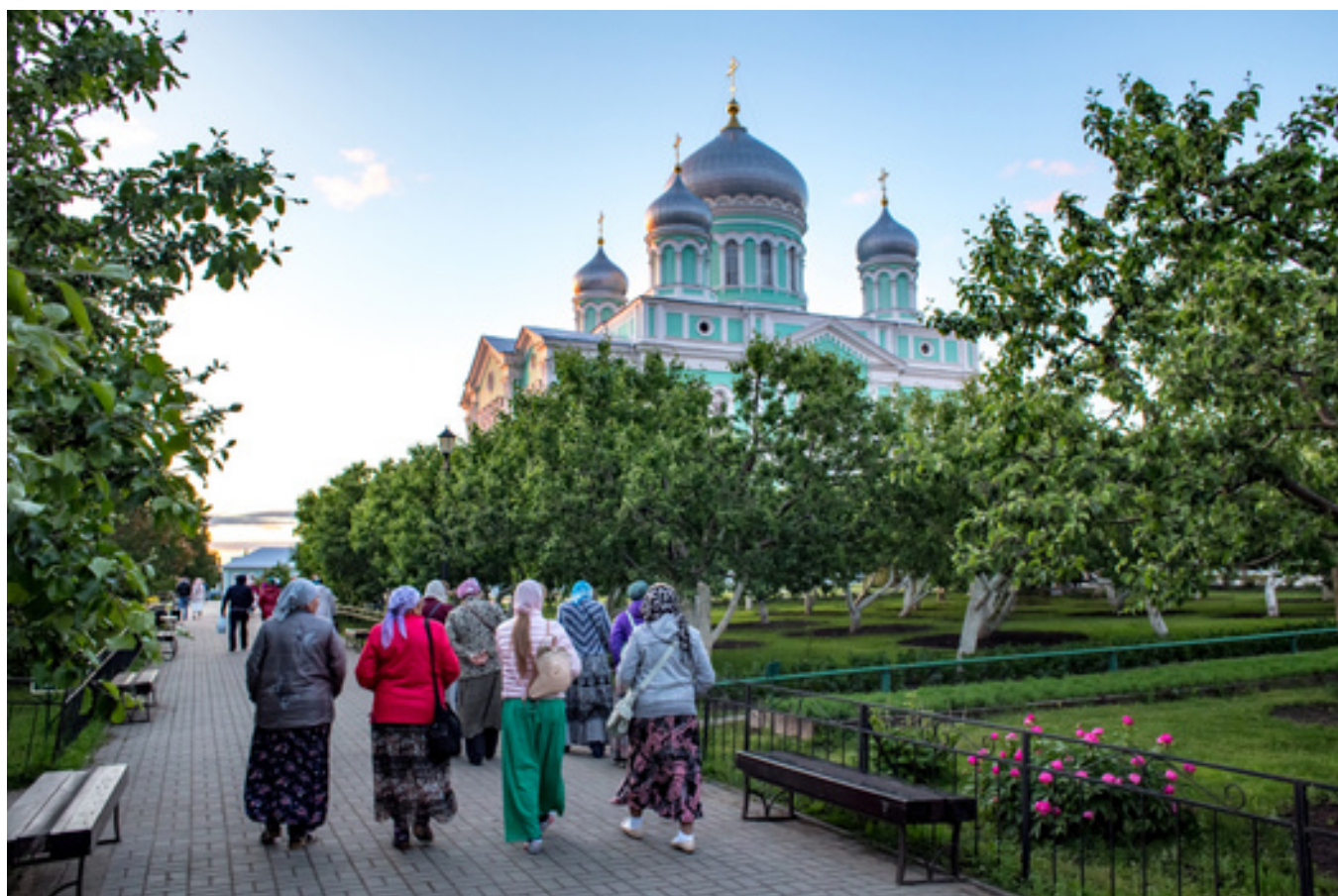
Паломники в Дивеево. 10 июня 2018 года

Постепенно полуразрушенный монастырь в Нижегородской области, по словам близкого к правительству собеседника «Медузы», превратился в «Афон для патриотов». Причем если Афон привлекал в основном петербуржцев — то есть людей из окружения Путина, то в Дивеево массово едут столичные технократы и представители бюрократической элиты.