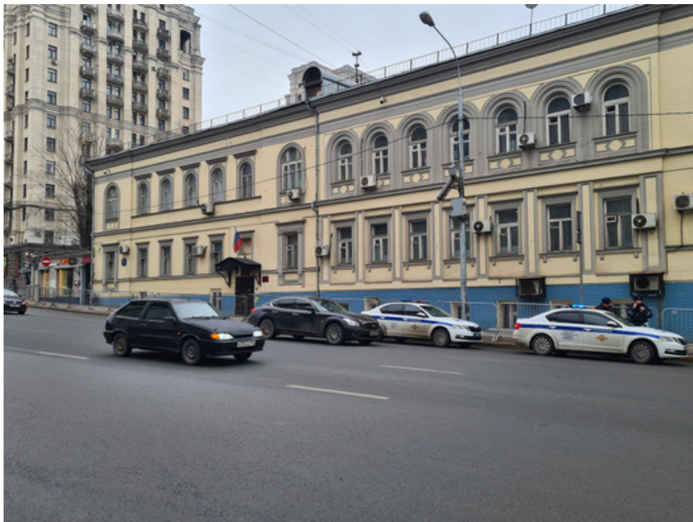
Денис Воронин / Агентство «Москва»