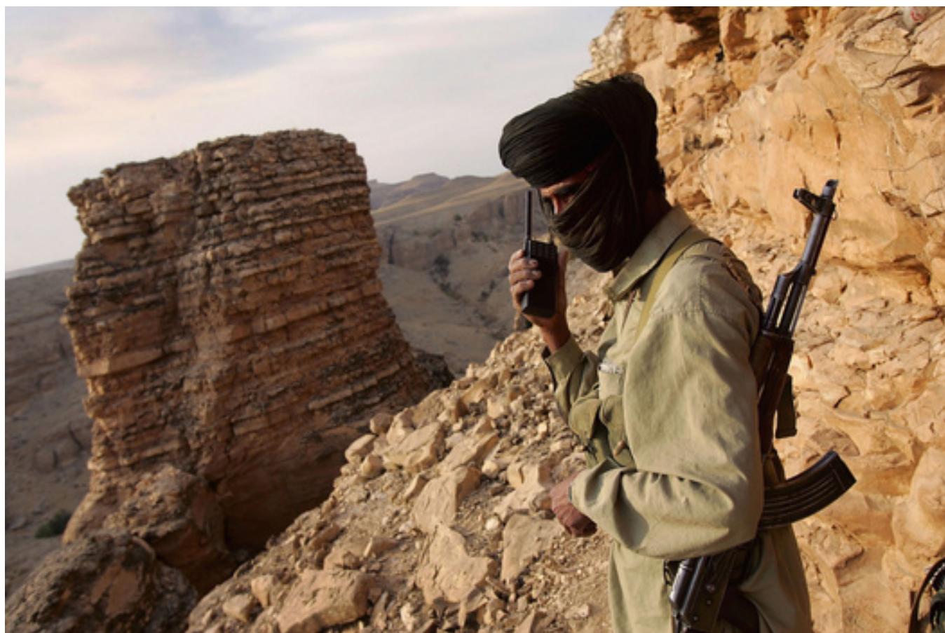
Белуджийский повстанец в Пакистане, 2006 год

С начала 2000-х годов на фоне усиления «Аль-Каеды» и других радикальных группировок вялотекущий конфликт перекинулся на соседние иранские провинции, также населенные белуджами, и, помимо политического, приобрел и религиозный характер (белуджи — сунниты, а основная часть населения Ирана — шииты). В регионе стали регулярно происходить теракты. Иран и Пакистан большую часть времени совместно боролись против радикалов и сепаратистов. По приблизительным оценкам, в общей сложности с 2000 года в регионе были убиты почти пять тысяч мирных жителей.