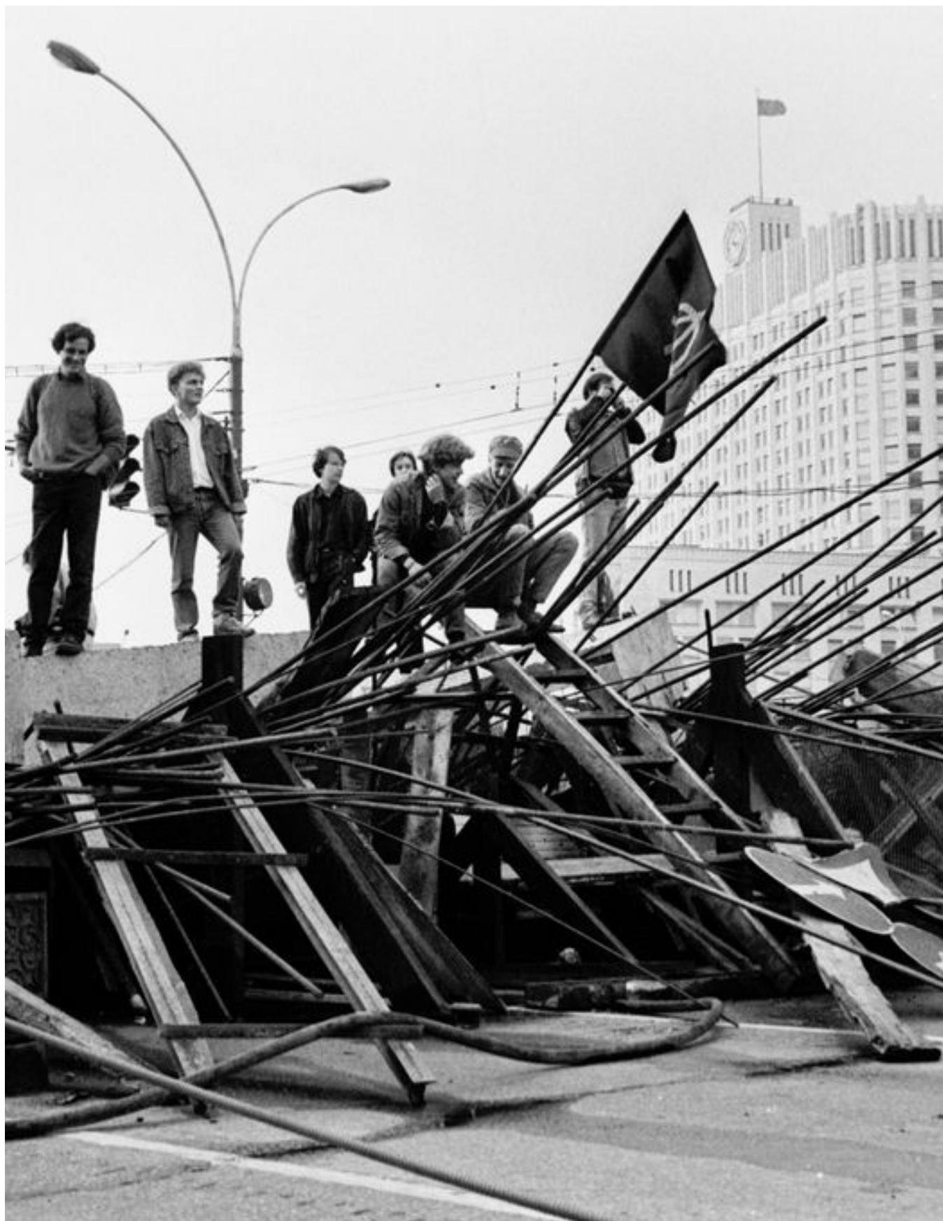
Баррикады возле Белого дома. 21 августа 1991 года