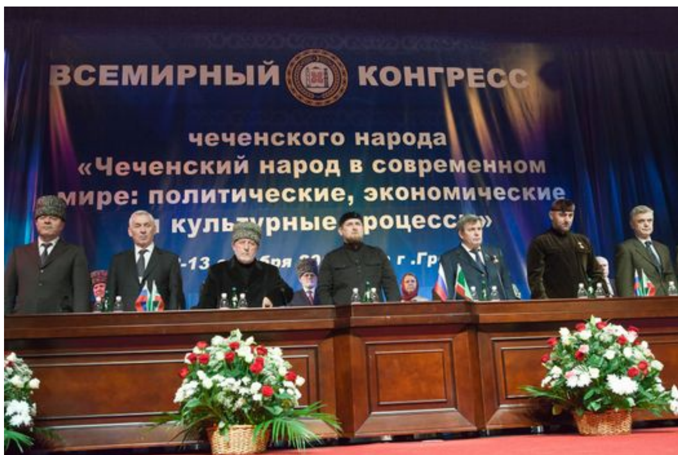
Кадыров и Хасбулатов на Всемирном конгрессе чеченского народа в Грозном. 11 октября 2010 года

В 2003 году он вновь говорил о планах участвовать в выборах главы Чечни — и снова от них отказался. На этих выборах президентом республики был избран Ахмат Кадыров. Хасбулатов поддерживал переизбрание его сына Рамзана Кадырова на новый срок в 2021 году, а тот назвал смерть экс-спикера «невосполнимой утратой» для чеченского народа.