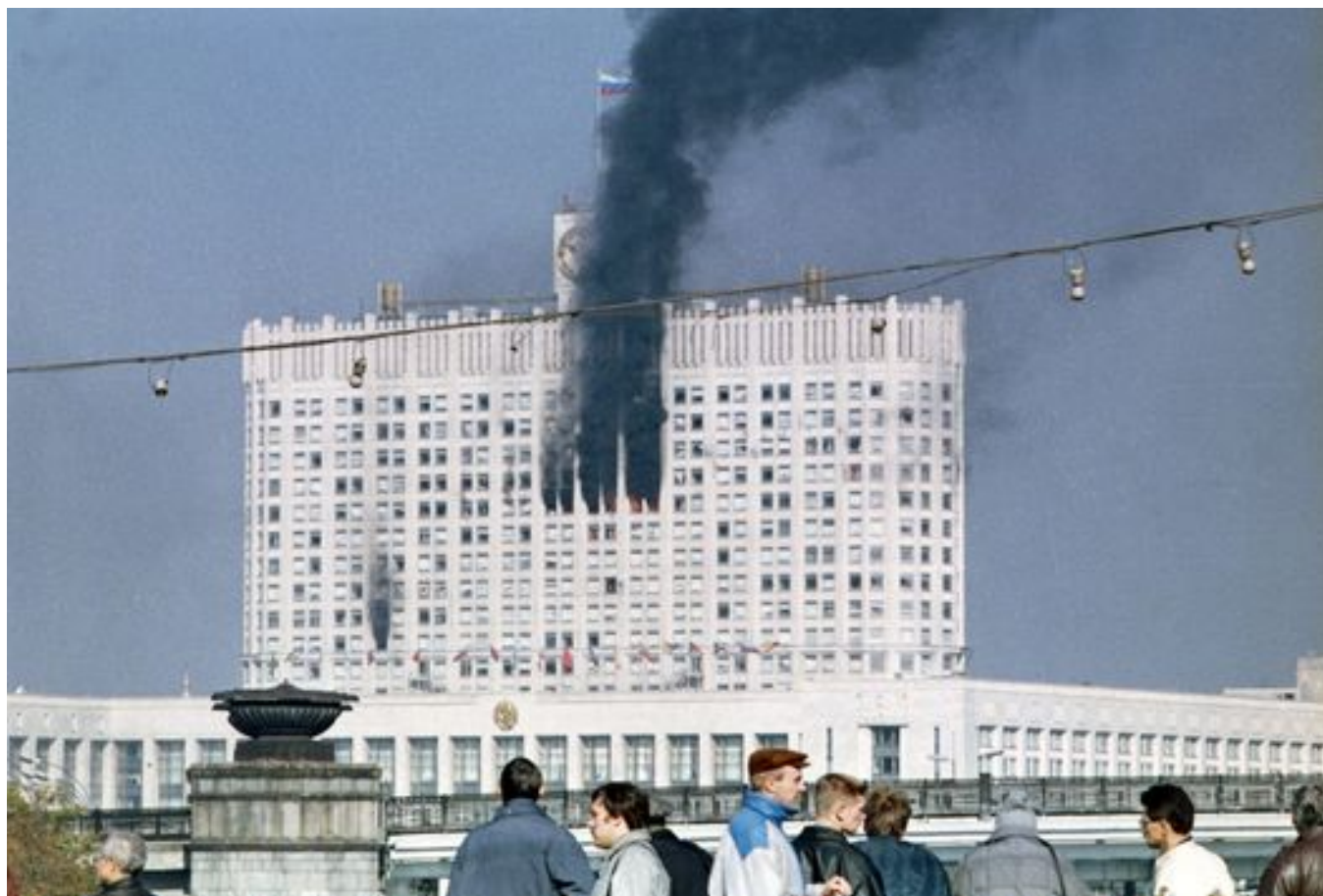
Вид на Белый дом после штурма. 4 октября 1993 года