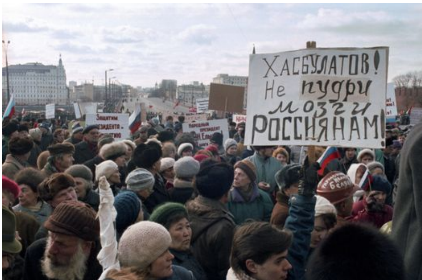
Сторонники Бориса Ельцина на Васильевском спуске у Кремля. 26 марта 1993 года

Противники Хасбулатова со временем начали сравнивать его со Сталиным (очевидно, намекая на кавказское происхождение и любовь к курению трубки).