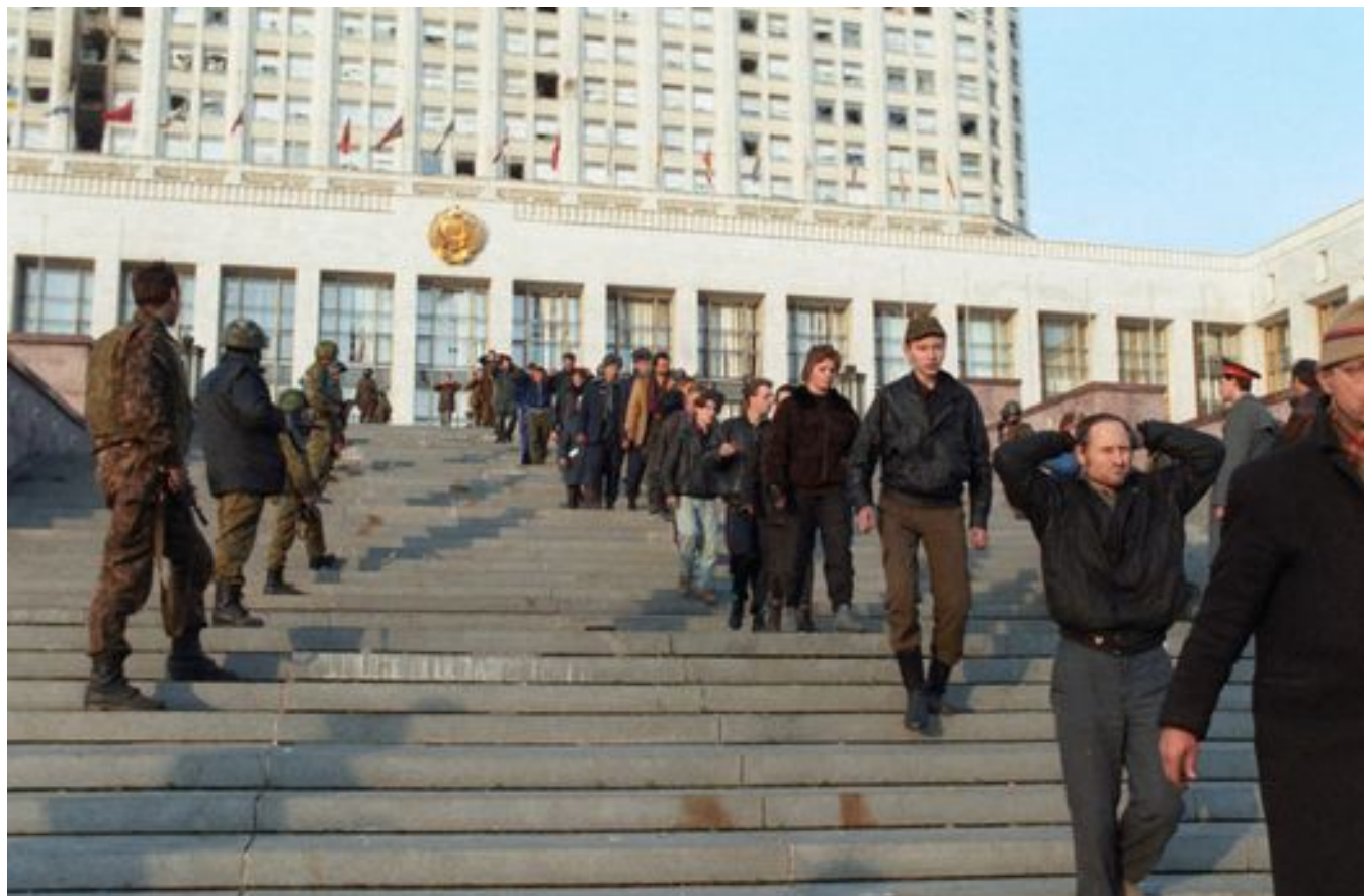
Защитники Белого дома покидают здание. 4 октября 1993 года

октябрьских событий, благодаря чему Хасбулатов был освобожден — несмотря на сопротивление Кремля.