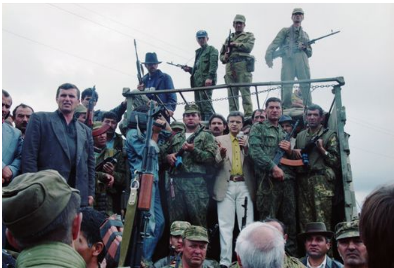
Митинг в поддержку Хасбулатова в Урус-Мартане. 18 августа 1994 года