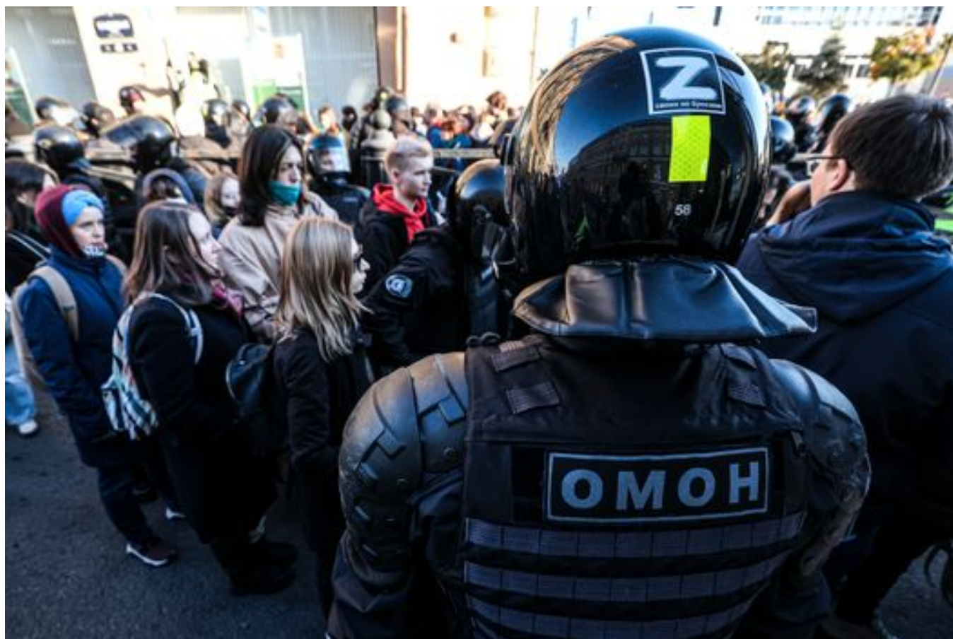
Группа задержанных на акции