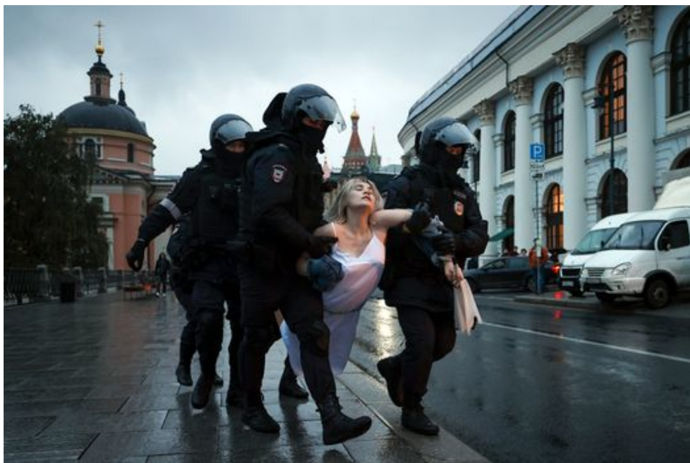
Михаил Терещенко / ТАСС