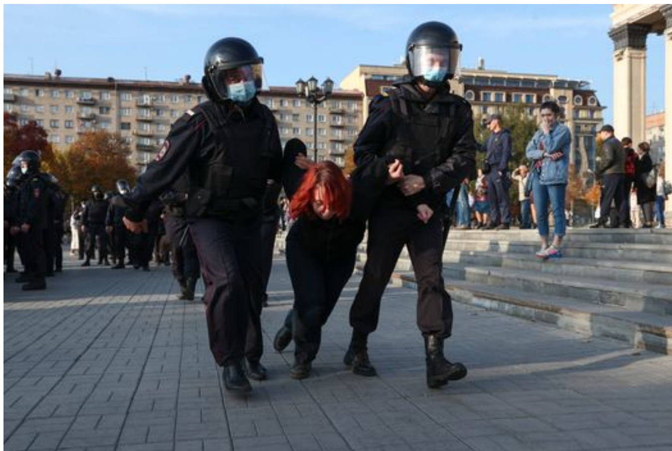
Кирилл Кухмарь / ТАСС