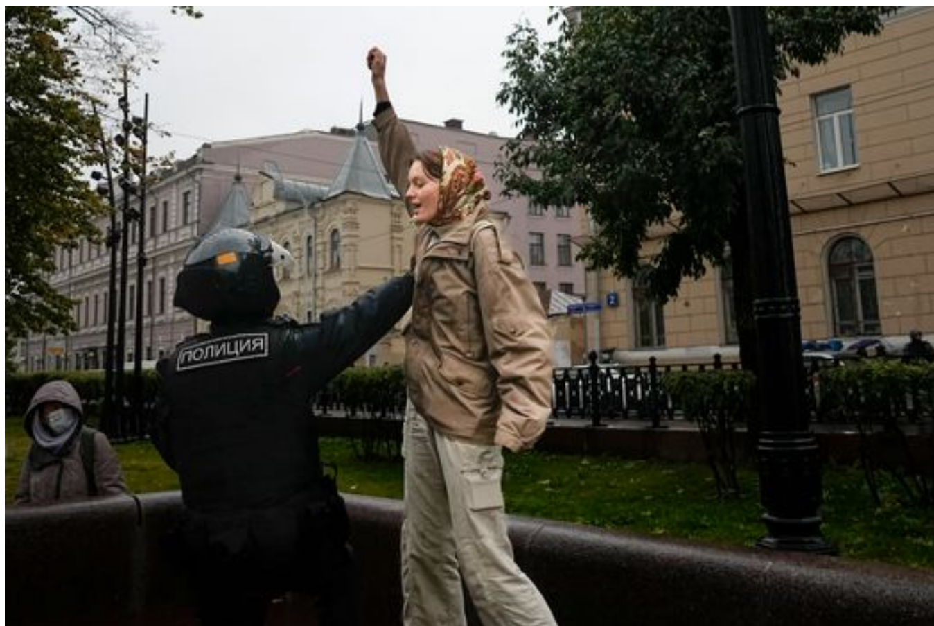
Полицейский задерживает девушку