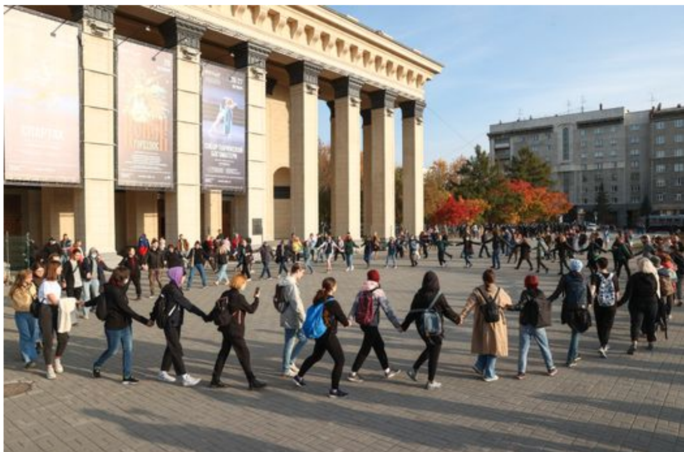
Начало акции протеста