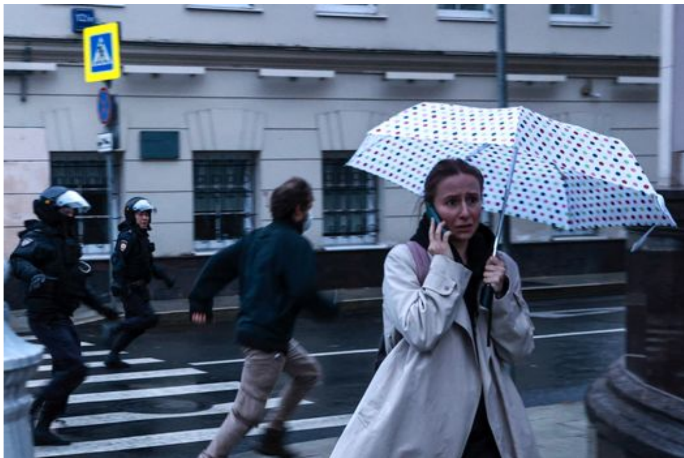
Полицейские бегут за участником акции