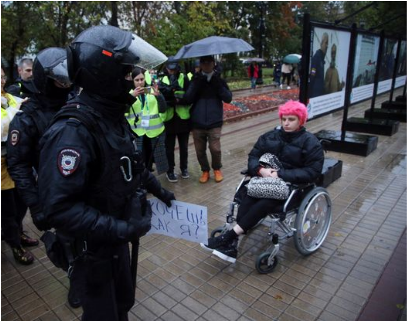
Полицейский с плакатом, изъятым у протестующей