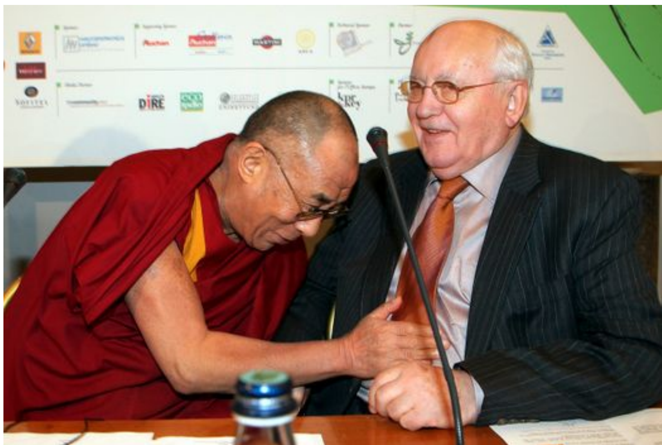
Михаил Горбачев и Лалай Лама Рим 15 декабря 2007 года