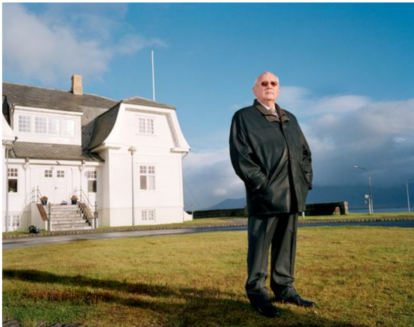
Михаил Горбачев в Рейкьявике — спустя 20 лет после переговоров с Рональдом Рейганом. Октябрь 2006 года