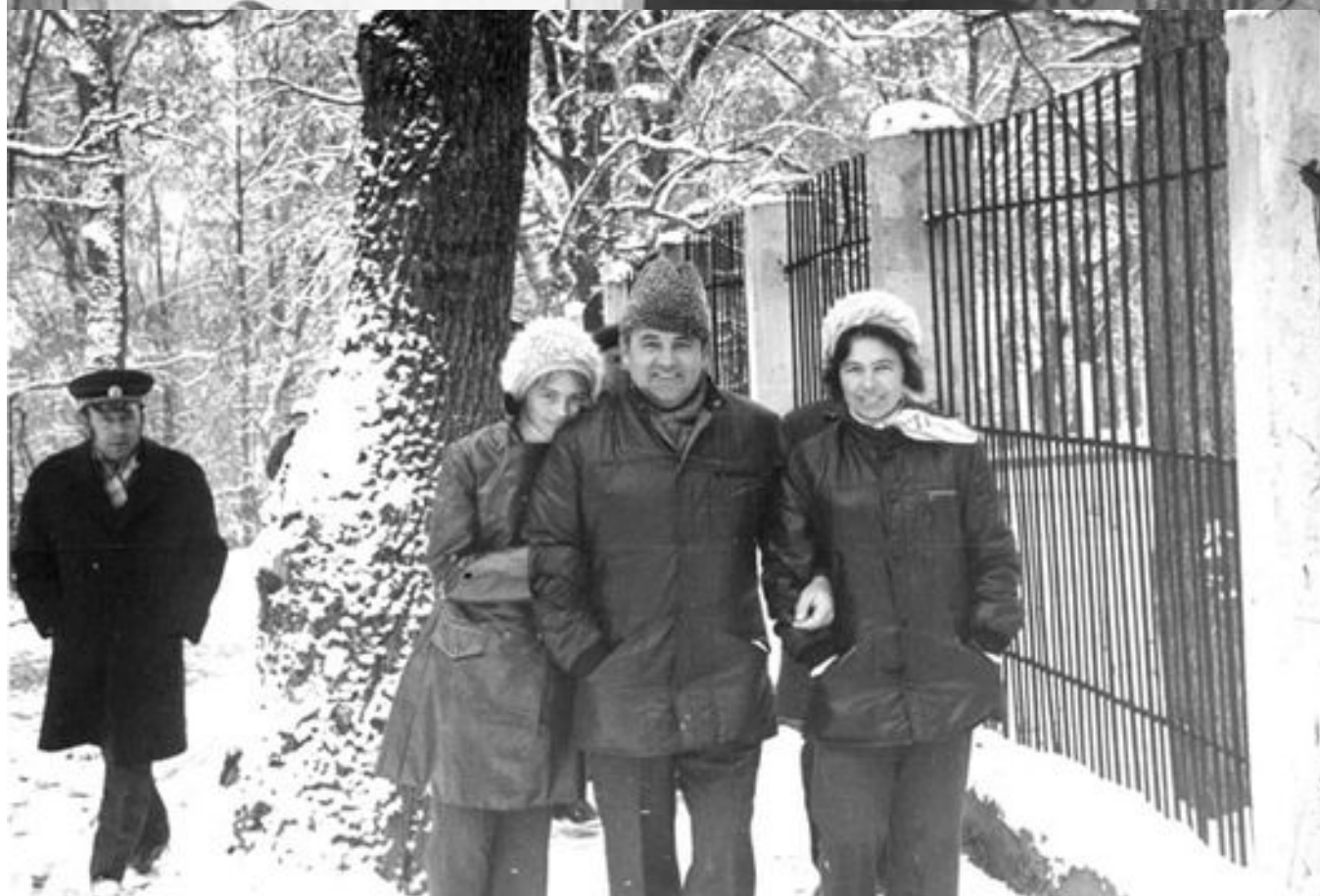
Михаил Горбачев с супругой Раисой Горбачевой и дочерью Ириной. Ставрополь, 1970-е годы