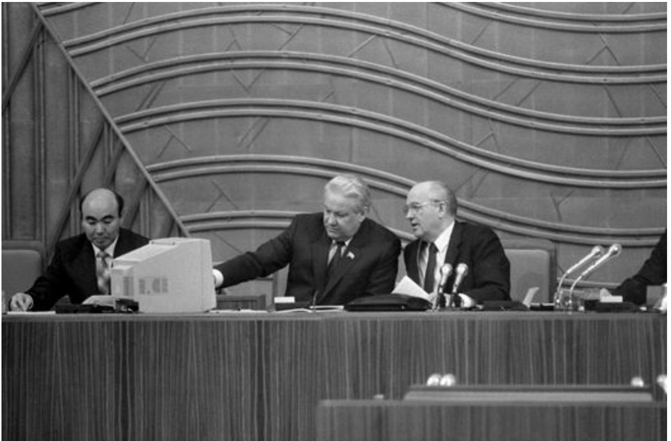
Михаил Горбачев (справа), Борис Ельцин и Аскар Акаев (будущий президент Киргизии) на съезде народных депутатов СССР. 17 декабря 1990 года