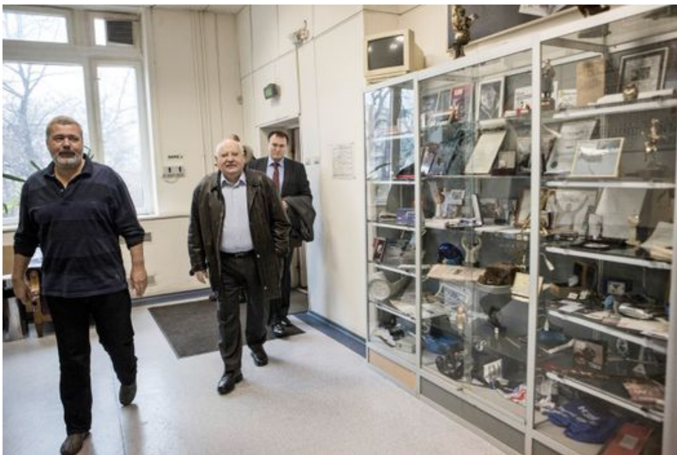
Михаил Горбачев и Дмитрий Муратов в редакции «Новой газеты». Горбачев был соучредителем издания. 22 ноября 2012 года