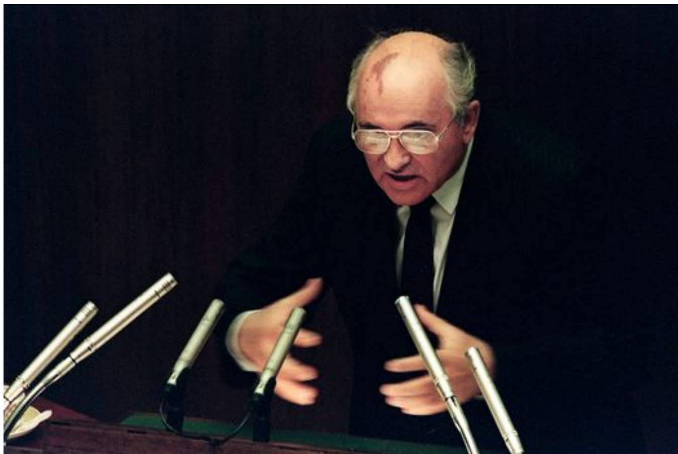
Михаил Горбачев выступает на заседании Верховного Совета СССР. 27 августа 1991 года