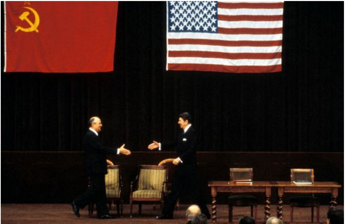
Михаил Горбачев и Рональд Рейган на переговорах в Женеве. Ноябрь 1985 года