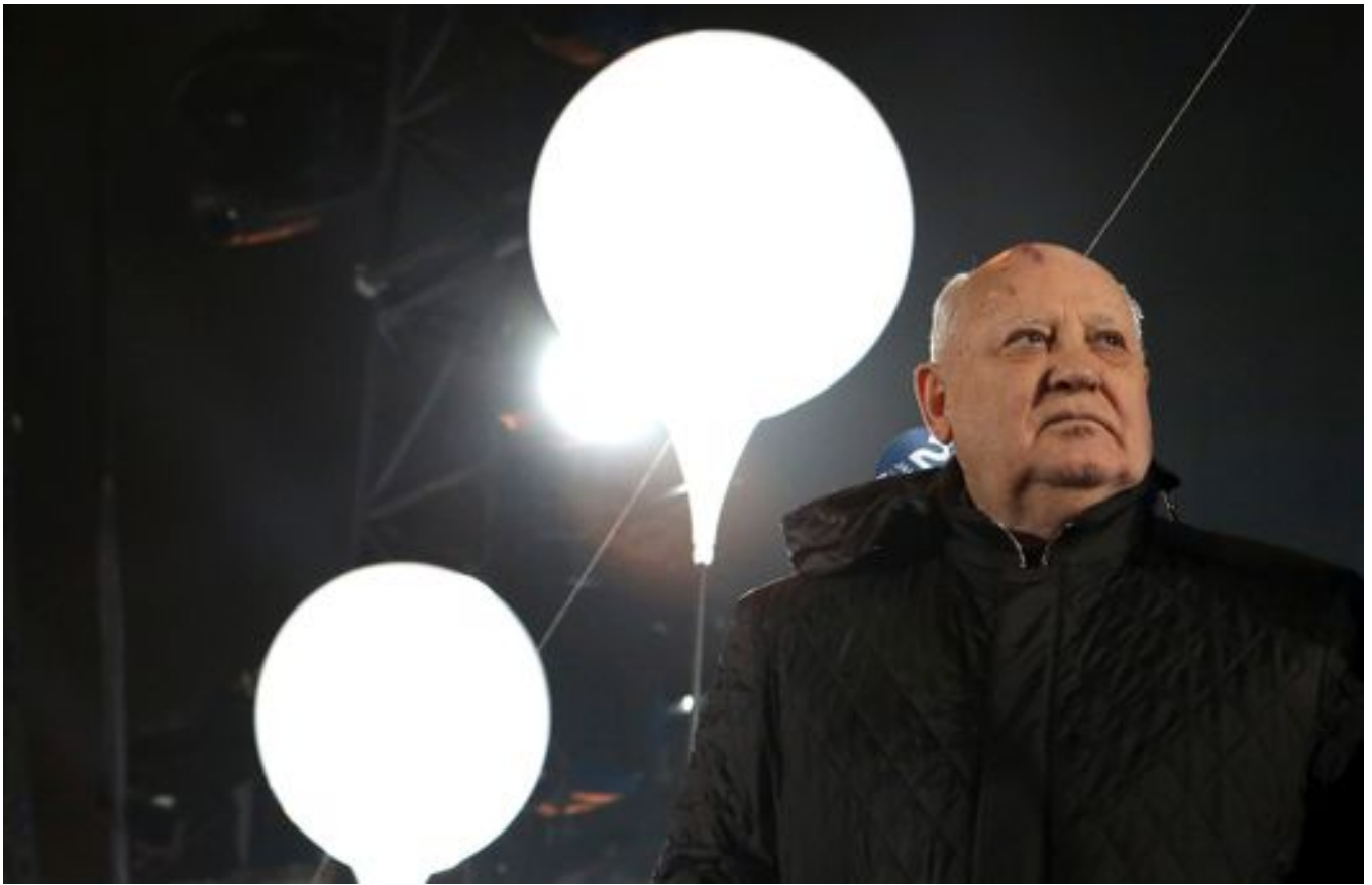
Михаил Горбачев на церемонии по поводу 25-й годовщины после падения Берлинской стены. Берлин, 9 ноября 2014 года