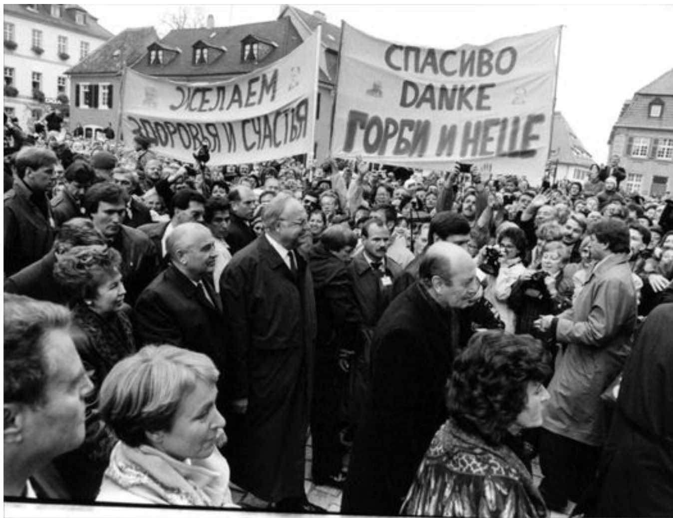
Михаил Горбачев и канцлер ФРГ Гельмут Коль в городе Шпайер. 1990 год