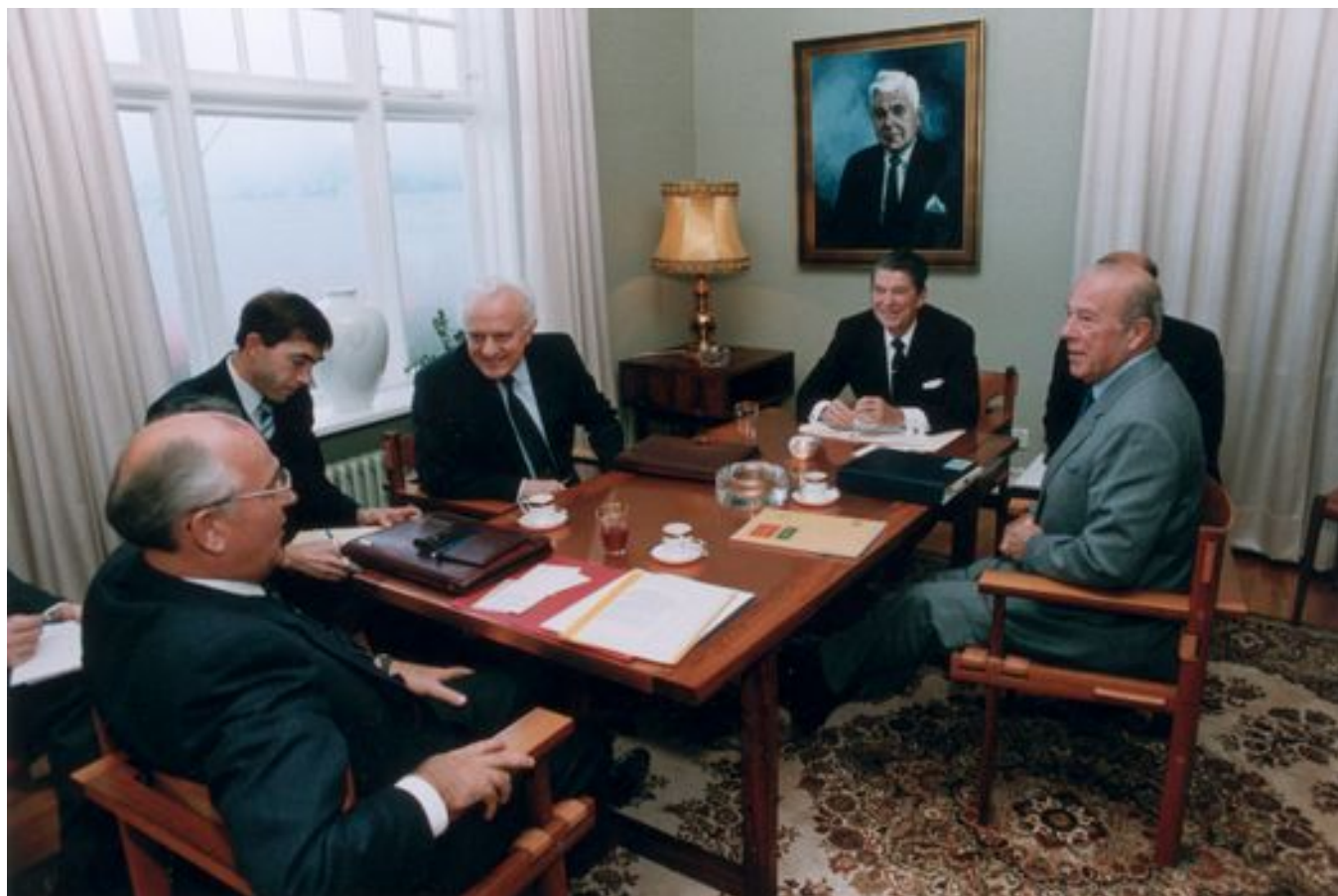
Михаил Горбачев на встрече с Рональдом Рейганом в Рейкьявике. 11 октября 1986 года