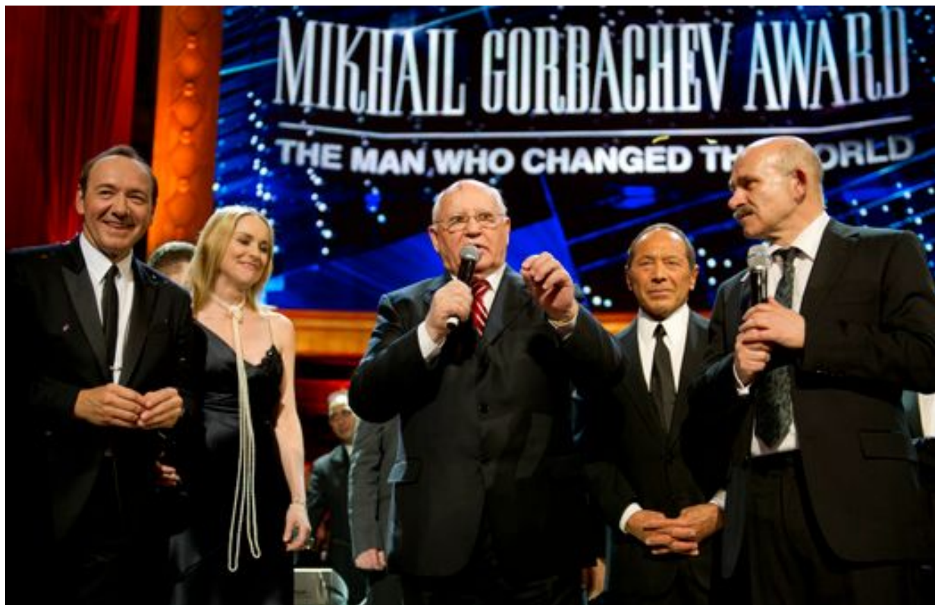
Михаил Горбачев, Кевин Спейси и Шэрон Стоун на концерте в честь 80-летия Горбачева. Лондон, 30 марта 2011 года