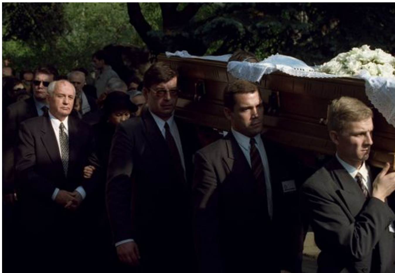
Михаил Горбачев во время похорон его супруги Раисы Горбачевой. 23 сентября 1999 года