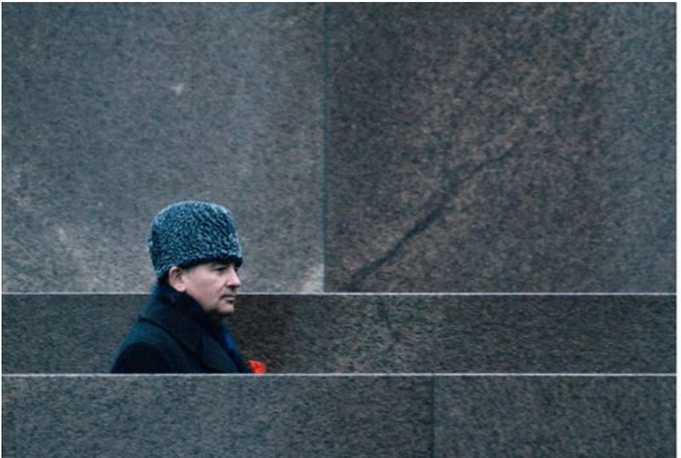
Михаил Горбачев на праздновании очередной годовщины Октябрьской революции. Москва, 7 ноября 1984 года