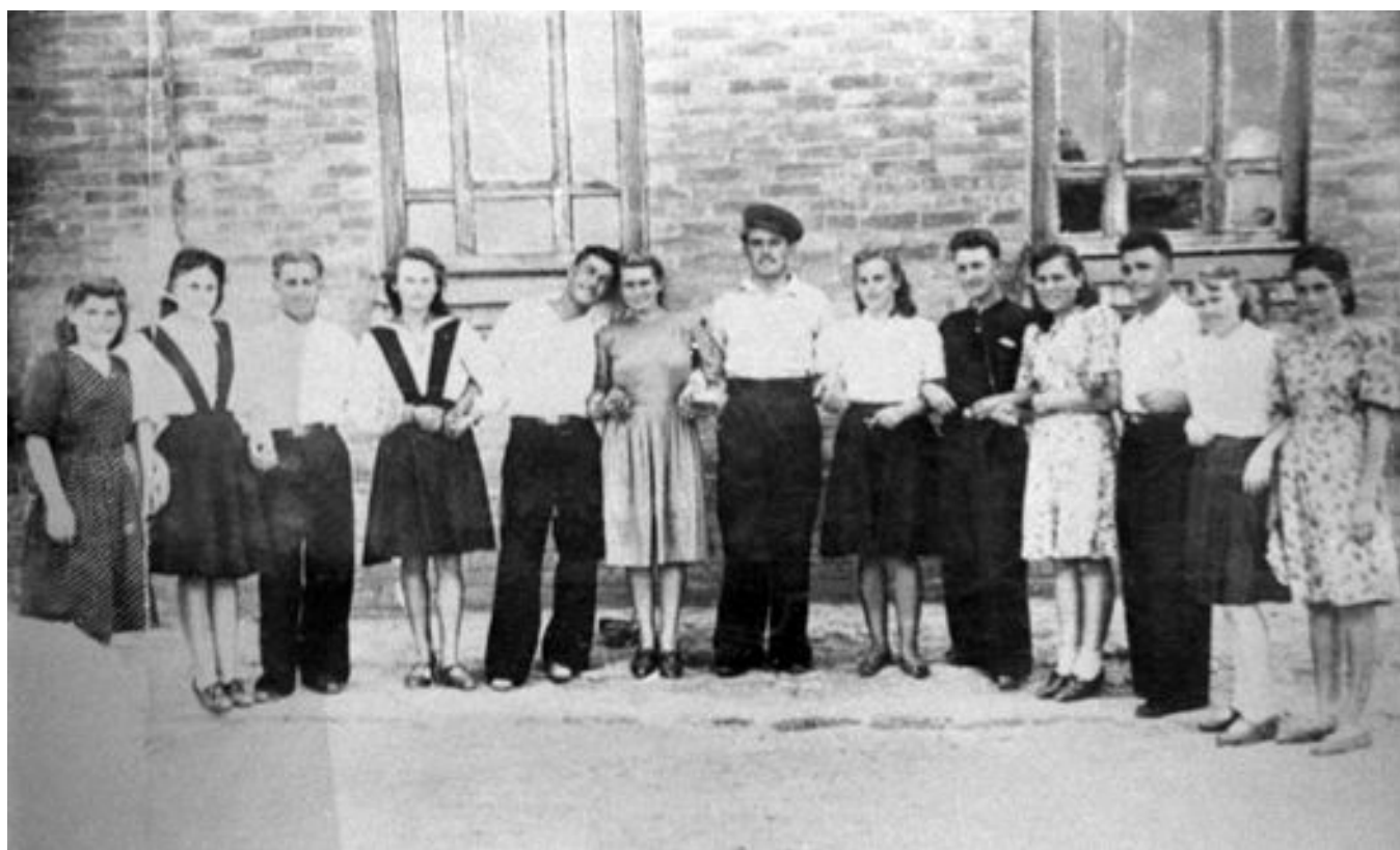
Михаил Горбачев (в центре в головном уборе) с одноклассниками. Советский Союз, 1940-е годы

30 августа 2022-го умер Михаил Горбачев — бывший генеральный секретарь ЦК КПСС, первый и единственный президент СССР, человек, завершивший холодную войну. В 1991 году, когда Горбачев ушел в отставку, казалось, что мир изменился навсегда. Это было время безграничной свободы и еще бóльшей надежды. Посмотрите, какой была жизнь Михаила Горбачева.