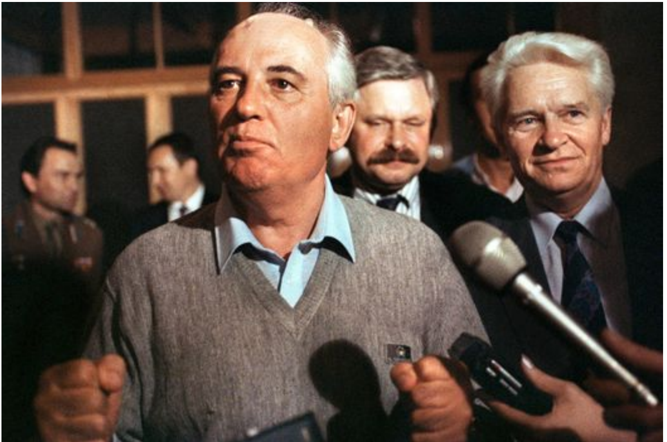
Михаил Горбачев после попытки государственного переворота ГКЧП. 21 августа 1991 года