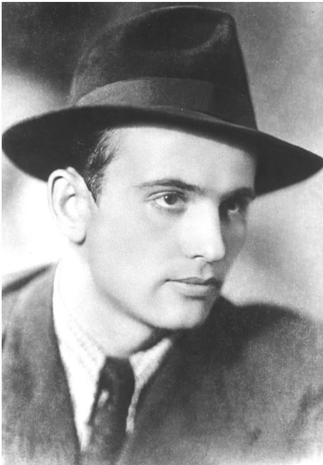
Михаил Горбачев. 1950-е годы