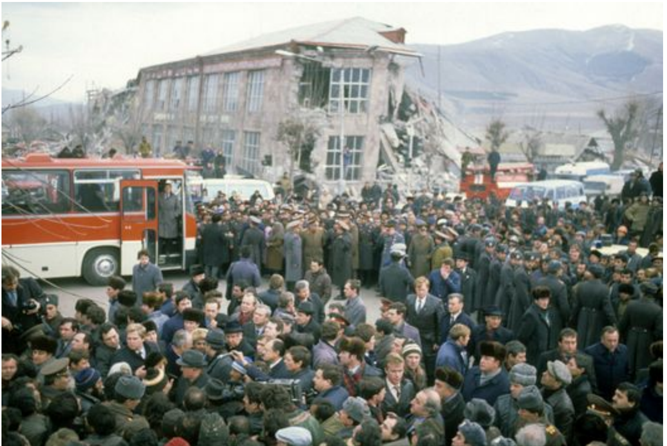
Михаил Горбачев и его супруга Раиса Горбачева встречаются с жителями армянского города Спитак, разрушенного из-за землетрясения. Декабрь 1988 года