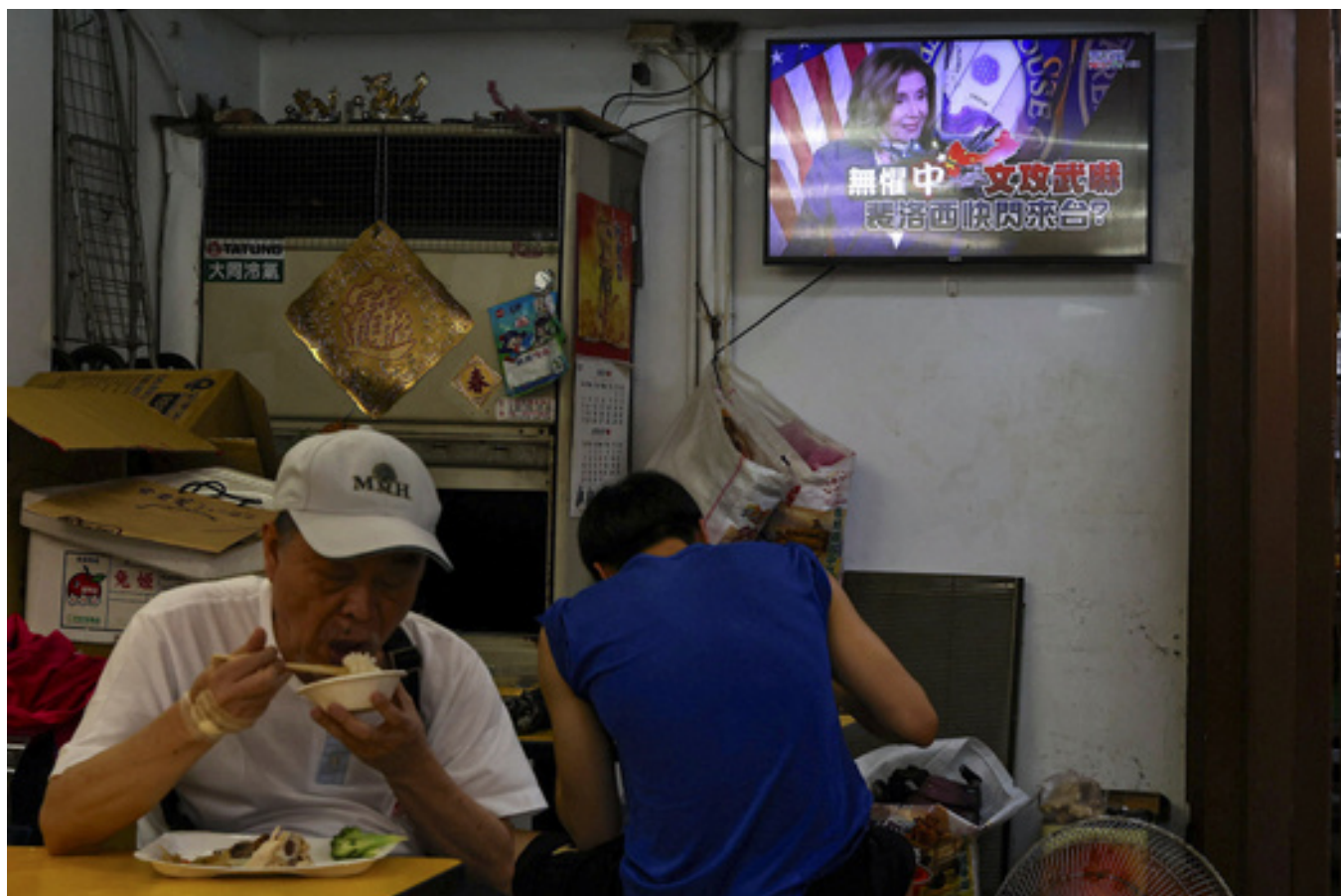
Посетители ресторана в Тайбэе. На заднем фоне — новостной выпуск с участием Нэнси Пелоси. Тайвань, 1 августа 2022 года

Это триггер [для КНР], потому что это выглядит как отход США от политики «одного Китая», по которой они признают Тайвань частью КНР и не признают Цай Инвэнь легитимной властью.