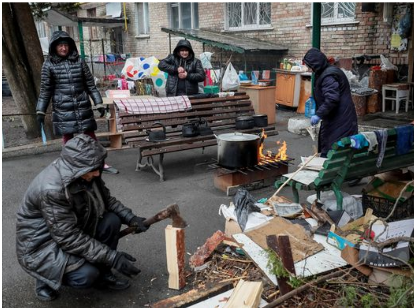
Жители Бучи готовят еду на костре во дворе