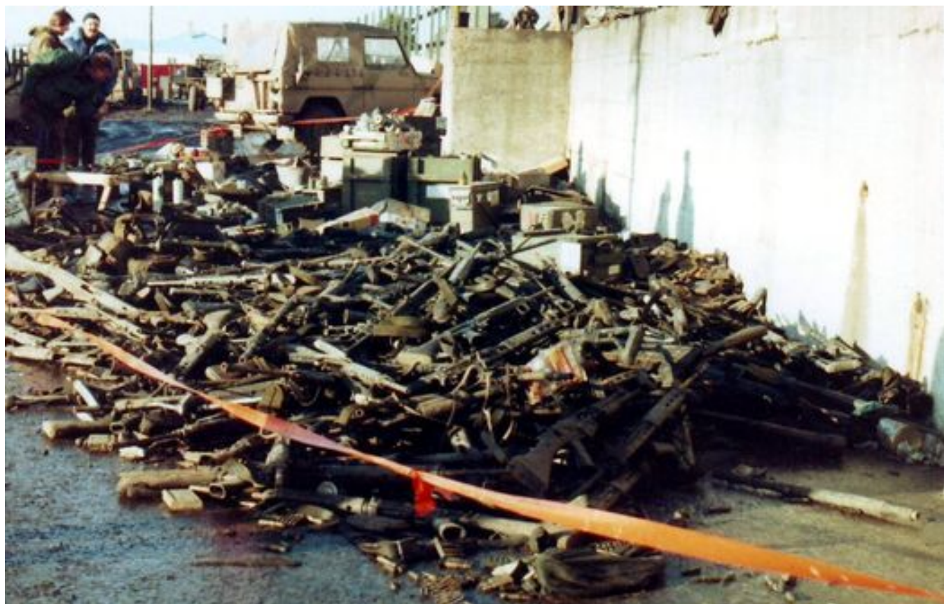
Куча выброшенного аргентинского оружия в Порт-Стэнли, столице Фолклендских островов. 15 июня 1982 года