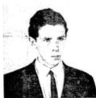
FERNANDO LUIS ABAL MEDINA alias "Fernando", argentino, 23 años de edad, soltero. Cofis Blanco, 1.85 mts. de estatura, delgado, C.I. No. 5.376.377 P. F. - L. C. No. 4.332.075.