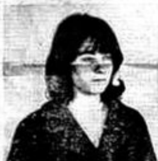
ESTHER NORMA ARROSTITO alias "Irma", argentina, 36 años de edad, casada. Cofis Blanco, 1.62 mts. de estatura, C. I. No. 4.718.023 P. F. - L. C. No. 3.878.285.