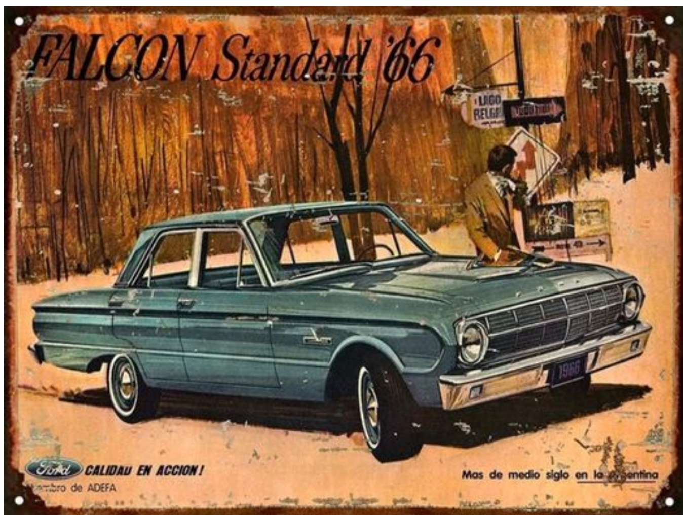
Реклама автомобиля Ford Falcon 1966