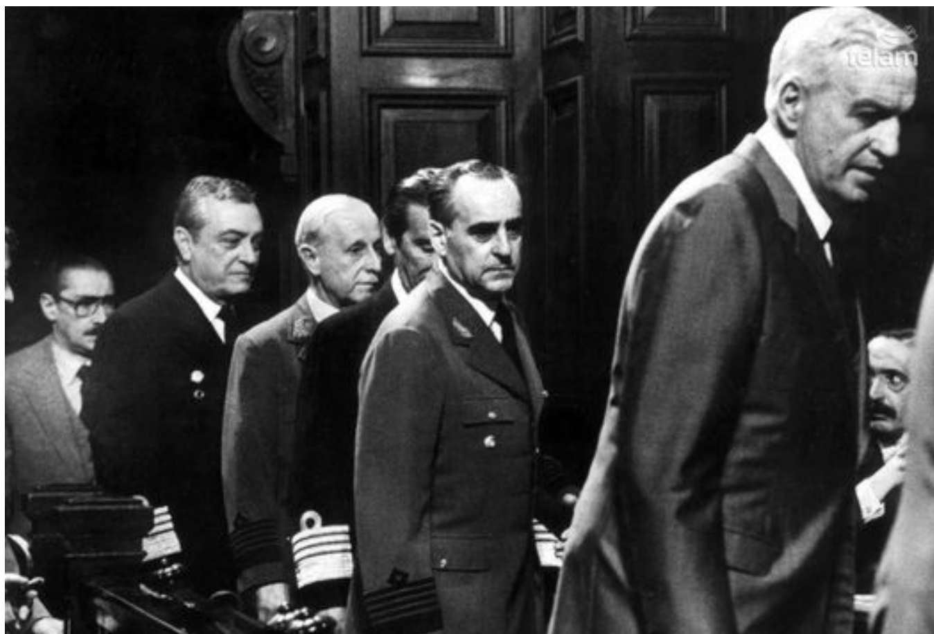
Суд над членами хунты. 22 апреля 1985 года