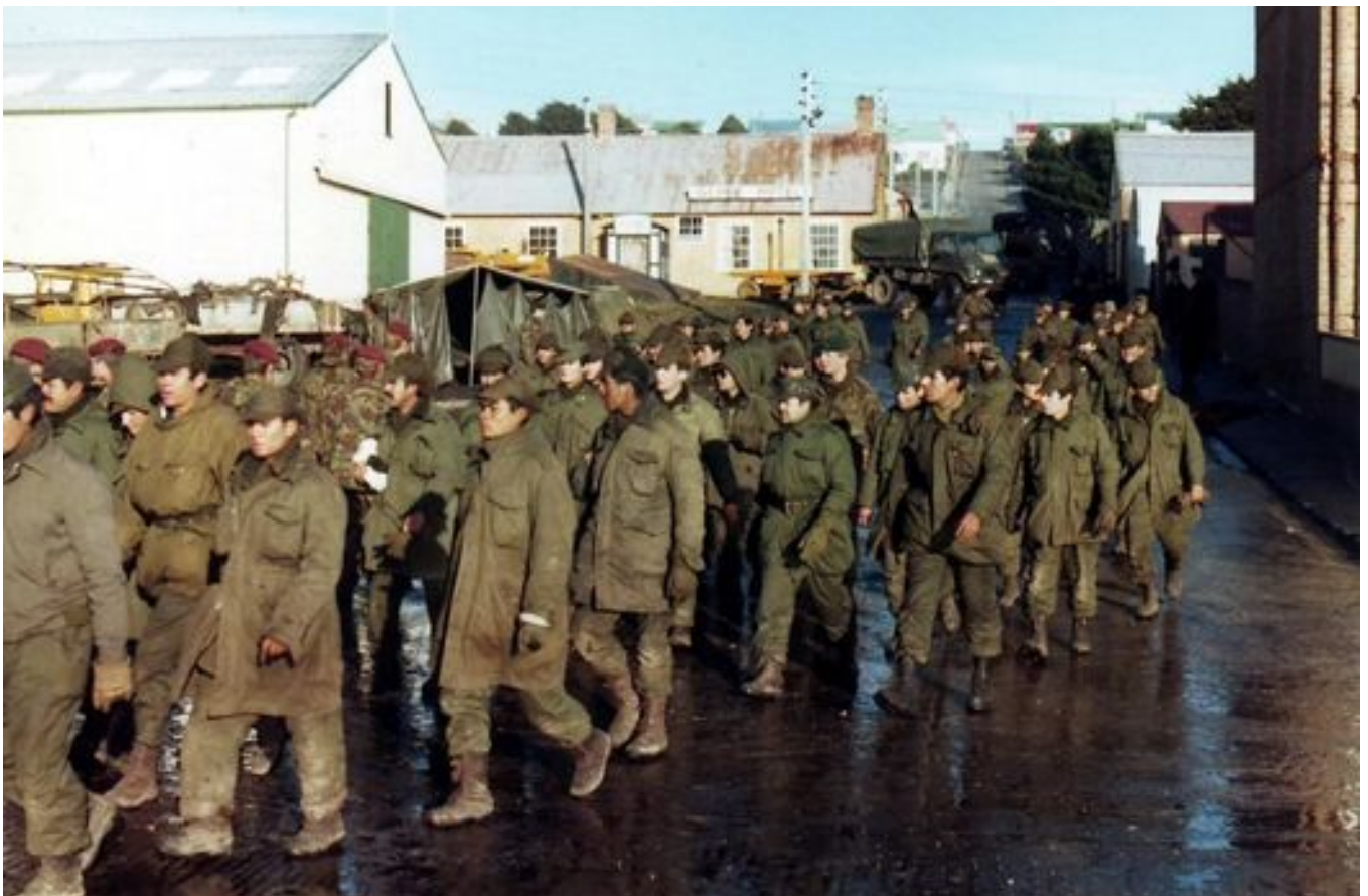
Аргентинские военнопленные в Порт-Стэнли, столице Фолклендских островов. 15 июня 1982 года

Это был просчет. Военные не ожидали такой решительной реакции Великобритании (6) . И не ожидали, что американцы будут помогать британцам.