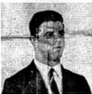
MARIO EDUARDO FIRMENICH alias "Manuel", argentino, 22 años de edad, soltero. Cofis Blanco, 1.66 mts. de estatura, C. I. No. A.872.021 P. F. - L. C. No. 7.794.358.