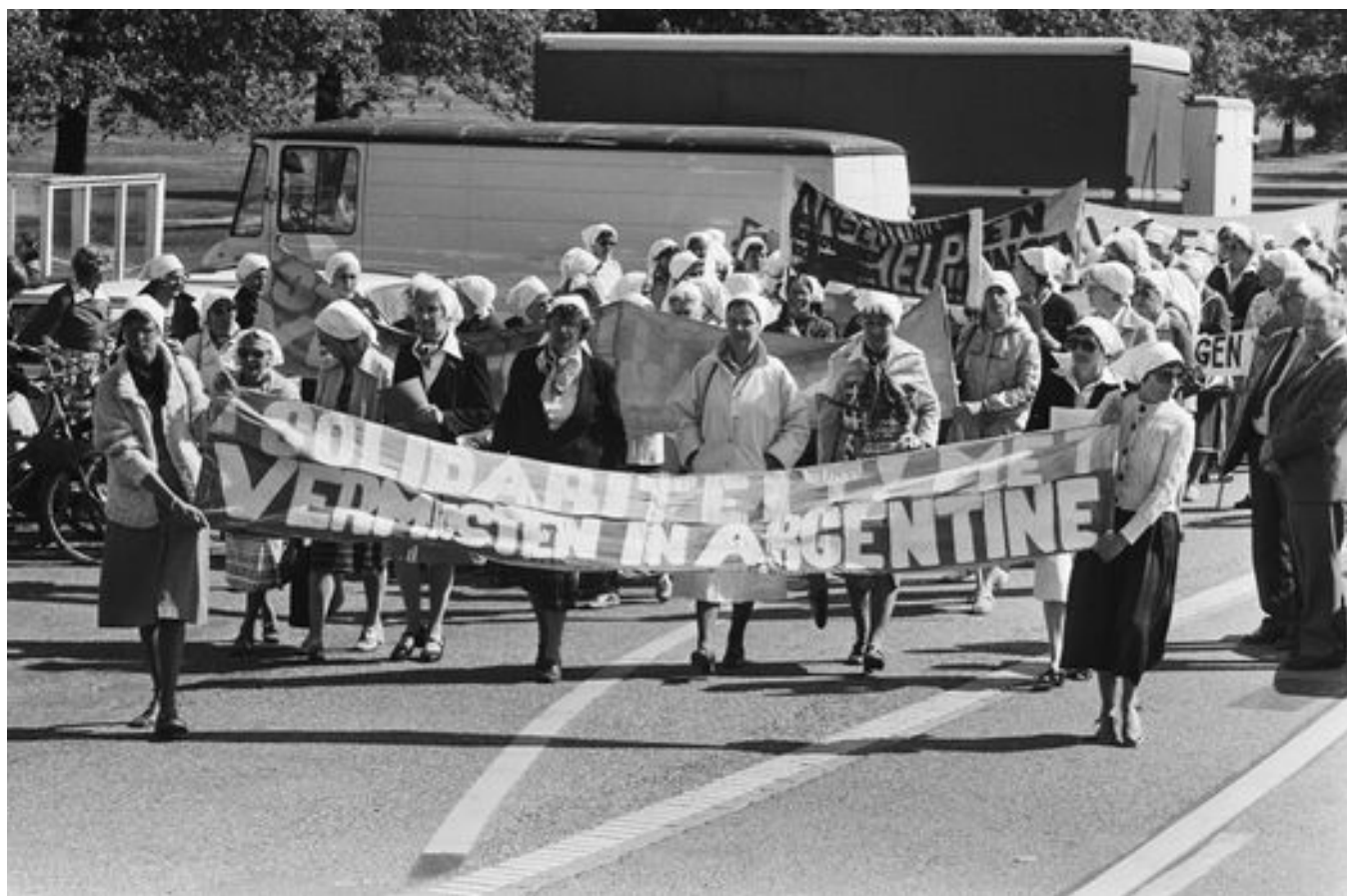
Матери пропавших на марше с требованием осудить виновных в похищениях. 22 мая 1980 года