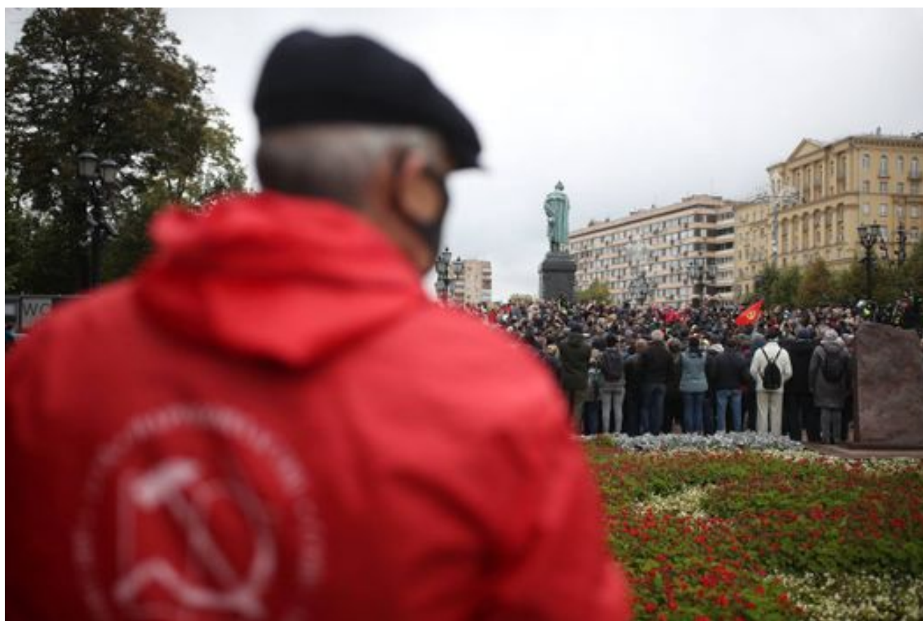
Митинг КПРФ. 25 сентября 2021 года

Массовых протестов по итогам выборов не было. И это один из главных политических итогов года. Машина, которая генерирует результаты правящей партии и близких к власти кандидатов, работает.