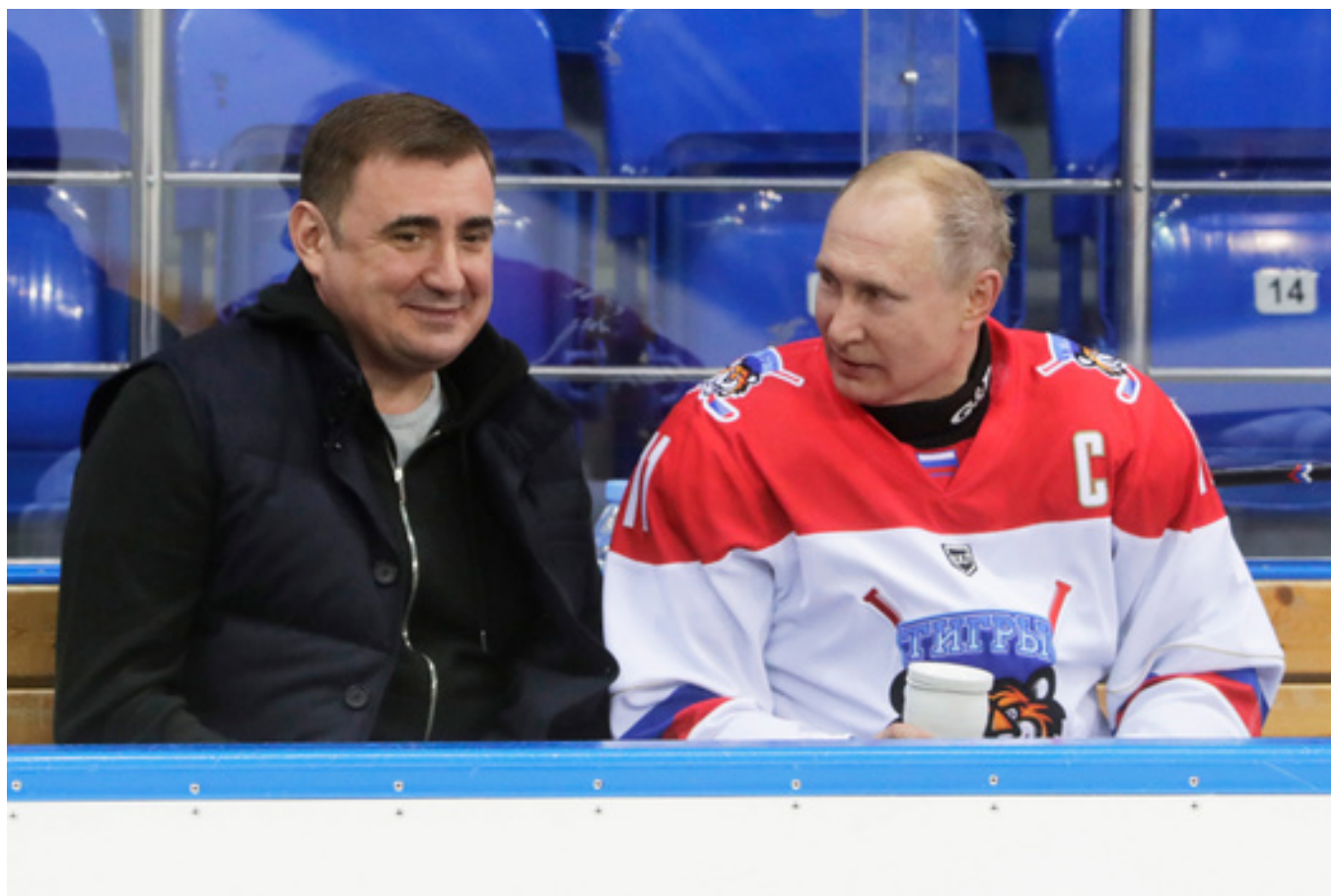
Губернатор Тульской области Алексей Дюмин и президент России Владимир Путин. 15 февраля 2019 года