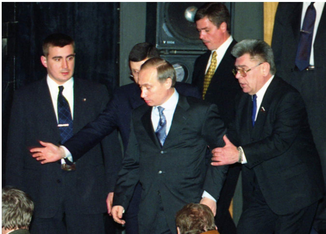
Замначальника охраны президента РФ Алексей Дюмин и и. о. президента РФ Владимир Путин. 2000 год

и именно он, по данным «Коммерсанта», руководил операцией по эвакуации в Россию президента Украины Виктора Януковича (правда, позже сам Дюмин участие в этой операции отрицал ). Потом Дюмин получил звание Героя России, недолго проработал замминистра обороны и уже в 2016 году занял пост губернатора Тульской области. В 2018-м он попал под санкции США.