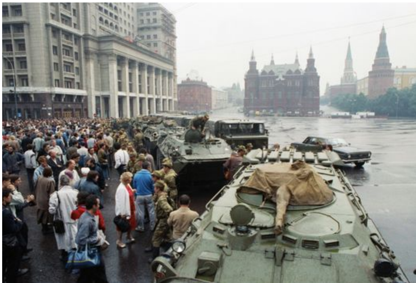
Военная техника и военнослужащие на Манежной площади Москвы. 19 августа 1991 года