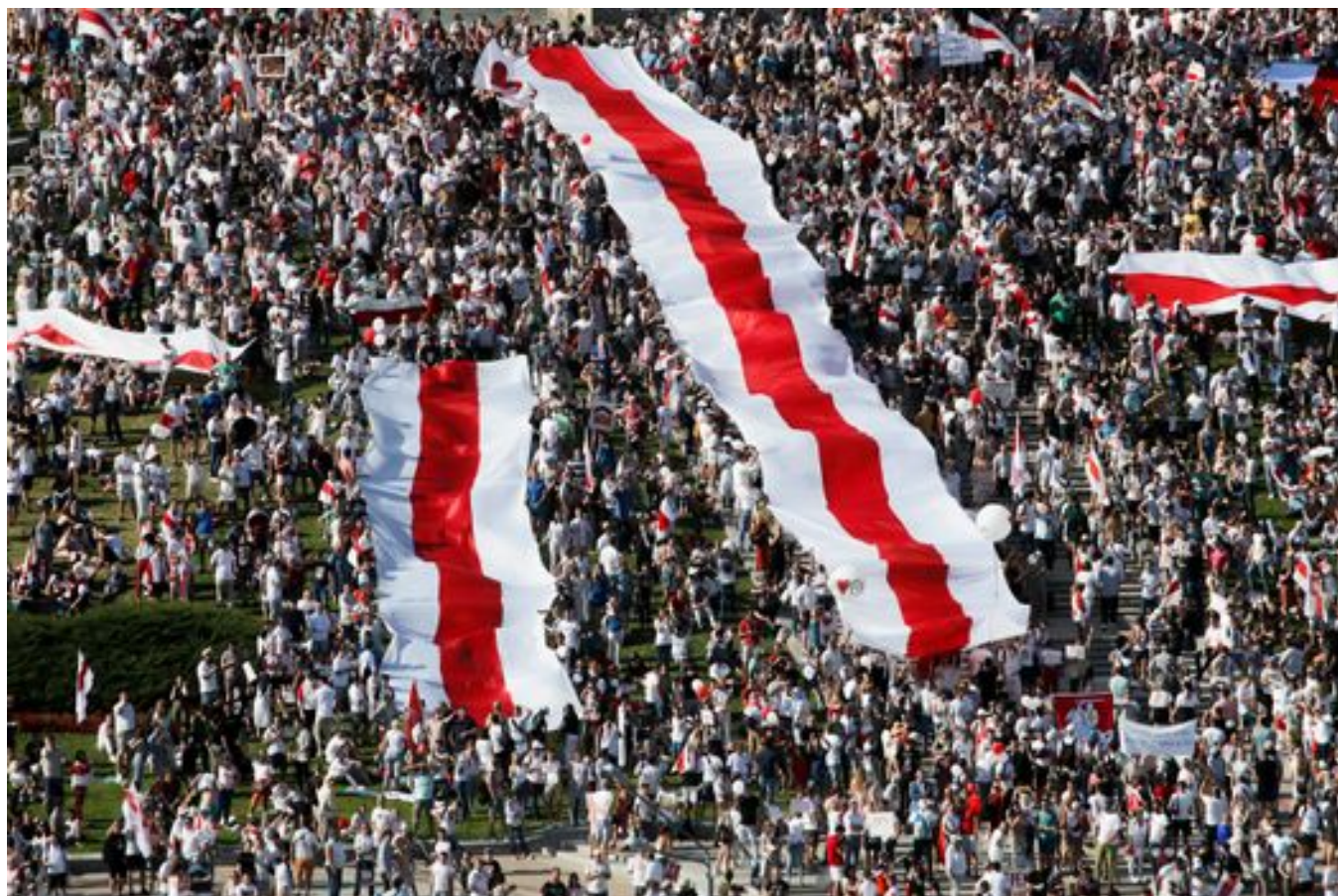
Марш в Минске, август 2020 года