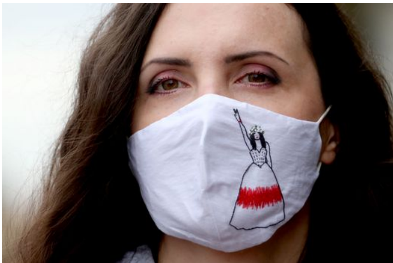
Минск, октябрь 2020 года