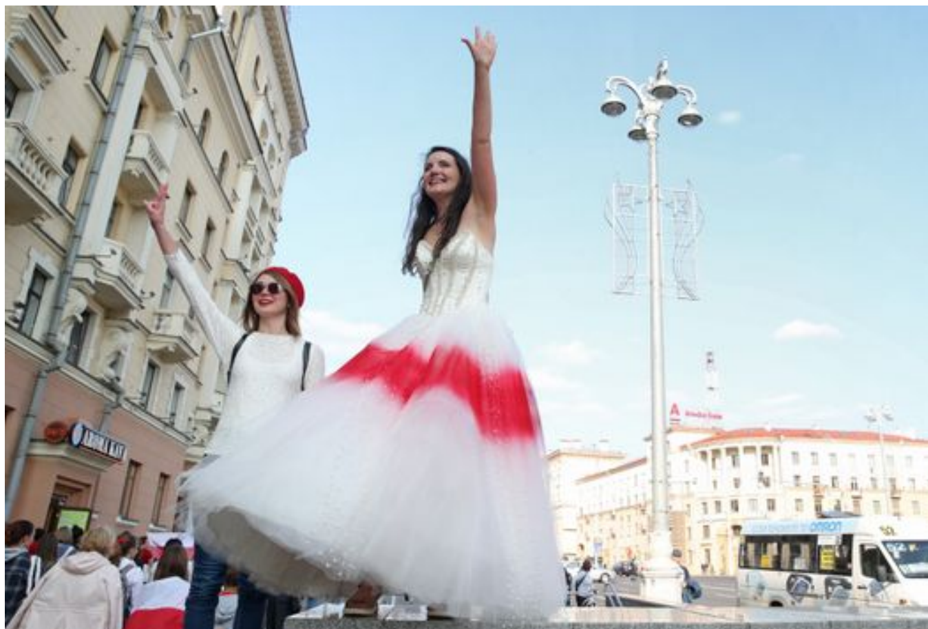
Женский марш в Минске, сентябрь 2020 года