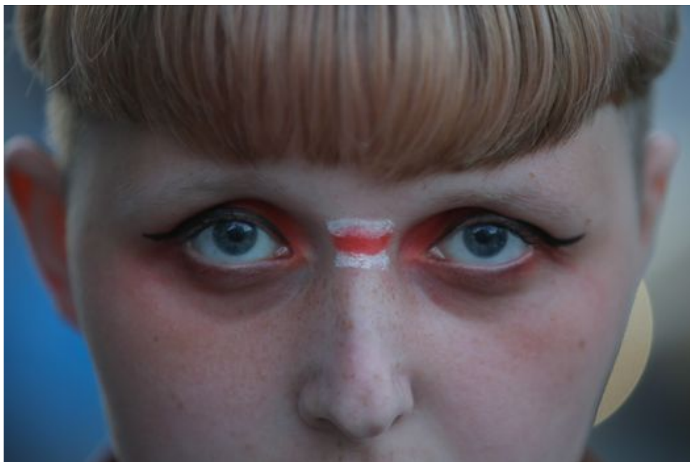
Участница акции у посольства Беларуси в Москве, август 2020 года