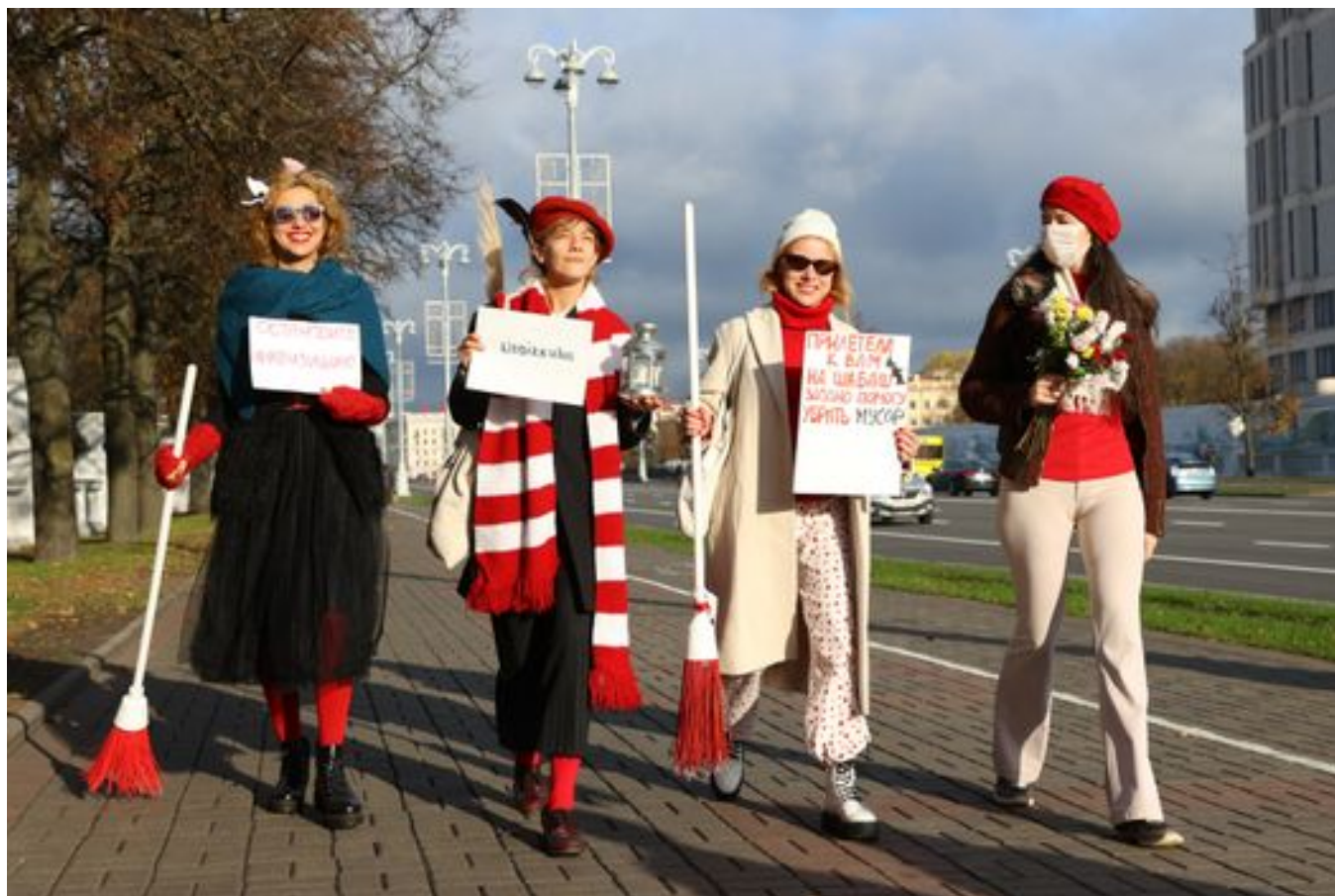
Женский марш в Минске, октябрь 2020 года