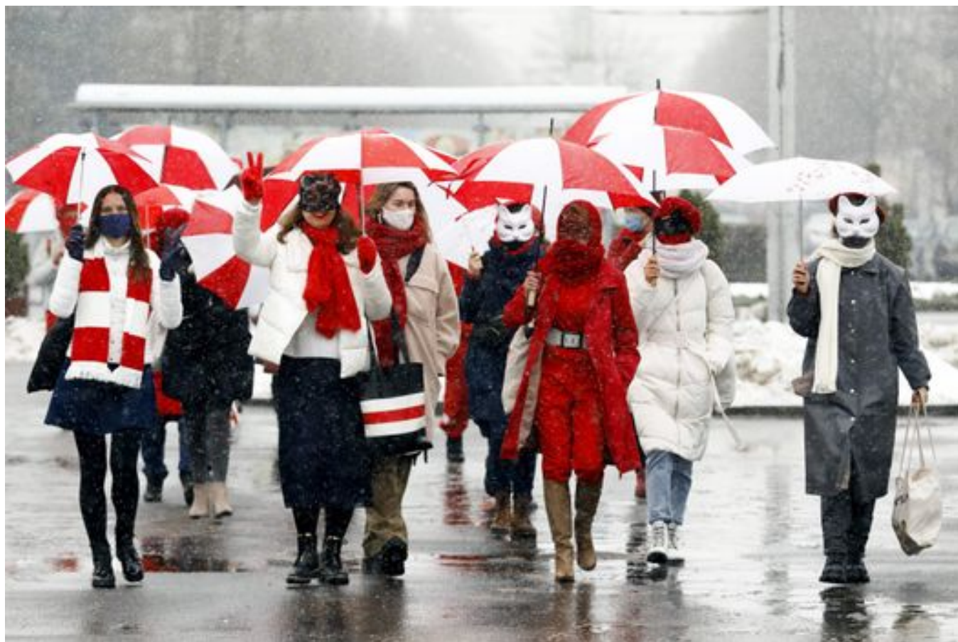
Минск, январь 2021 года