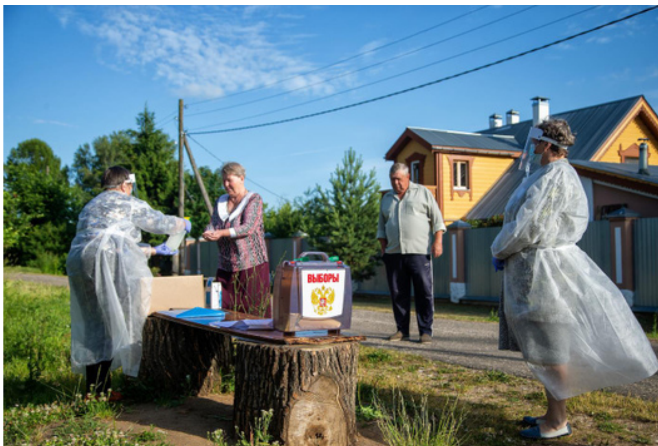
Передвижной избирательный участок в деревне Турово. 25 июня 2020 года

голосов и абсолютно достоверный протокол голосования. По сути, в этом году Кремль открыто сказал гражданам — у вас могут быть любые настроения, но нужный результат на выборах мы все равно себе обеспечим, вот наши три дня, вот голосования «на пеньках», вот лежащие в избиркомах безо всякого наблюдения сейф-пакеты. Новая искренность во всей ее красе. Итоги плебисцита и выборов говорят сами за себя — за поправки в Конституции по официальным данным проголосовали 78% россиян при явке в 68%. Большинство кремлевских кандидатов в губернаторы набрали больше 70% голосов.