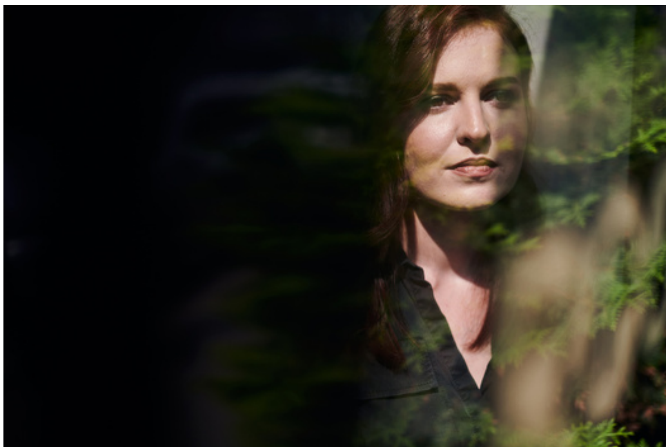
Семен Кац для «Медузы»

— Означает ли это, что Алексей не может позволить себе критиковать других? Он же не пишет: «Ату его, давайте все замочим Голунова!» Он пишет то, что думает, а люди реагируют так, как они хотят.