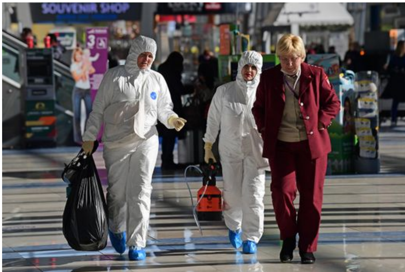
Сотрудники Роспотребнадзора в аэропорту Владивостока. 31 января 2020 года