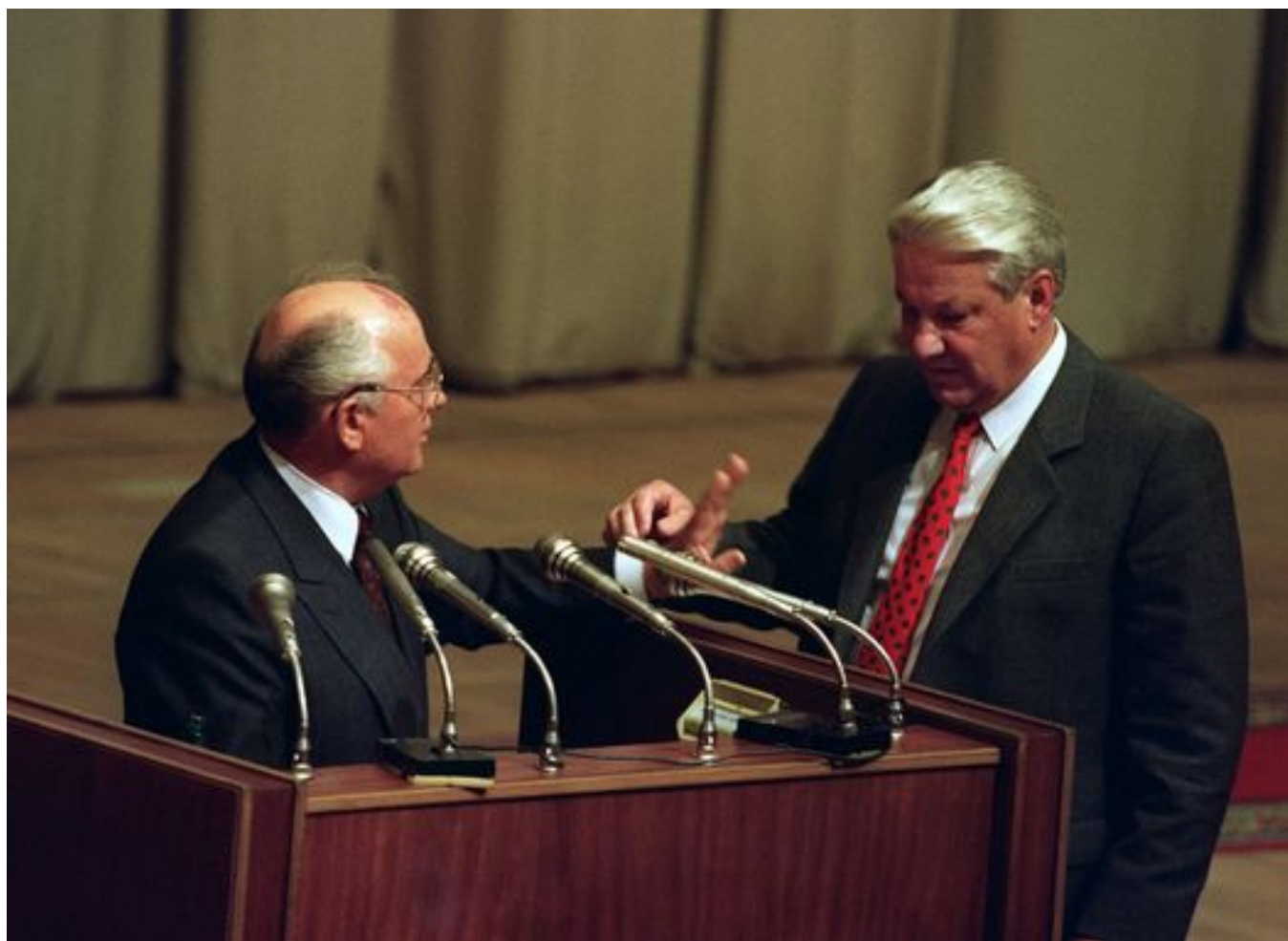
Михаил Горбачев и Борис Ельцин на заседании Верховного совета РСФСР, 23 августа 1991 года

Горбачев пришел в Дом Советов к депутатам России. Не на сессию, просто на встречу. Наверное, из чувства благодарности за выручку. В президиуме был Горбачев, Ельцин, далее Хасбулатов. Но вскоре к ним присоединились Руцкой и Силаев.