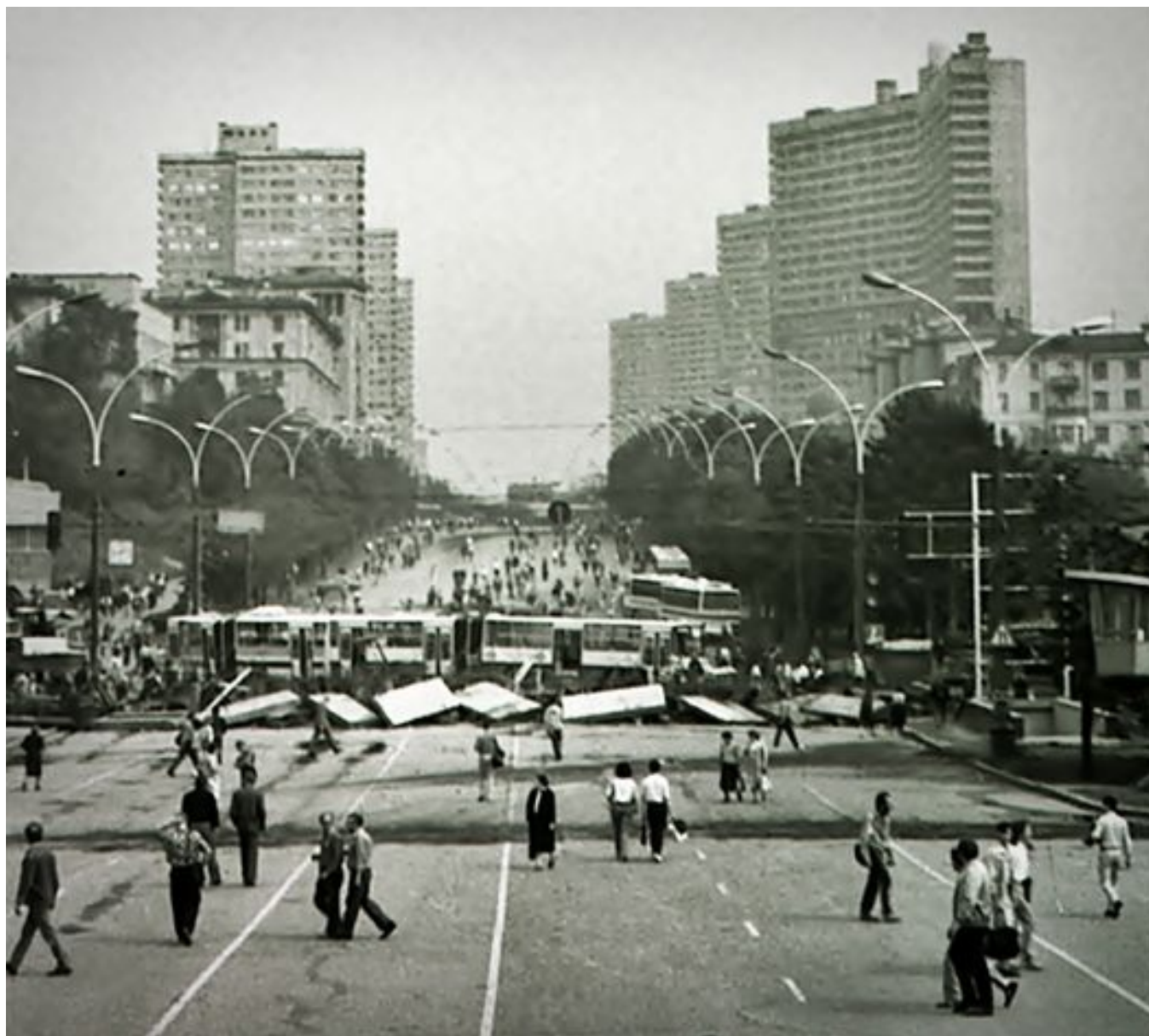
Баррикада на Калининском проспекте (Новый Арбат)